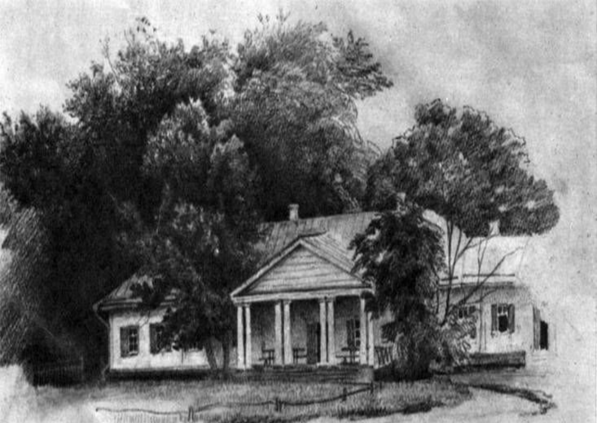
Дом Гоголей в Васильевке. Художник Н.А.Ярошенко. 1876 г.