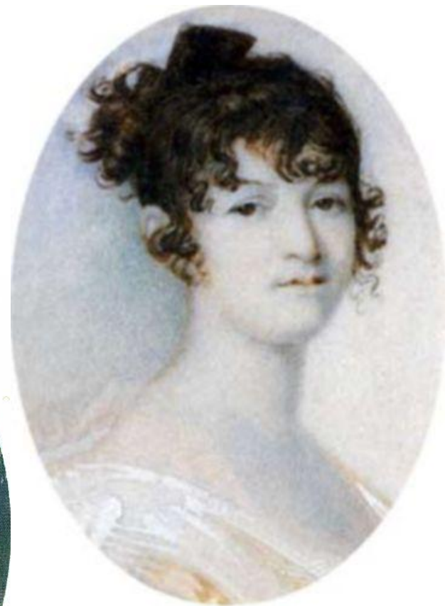
Надежда Осиповна Пушкина (Ганнибал)