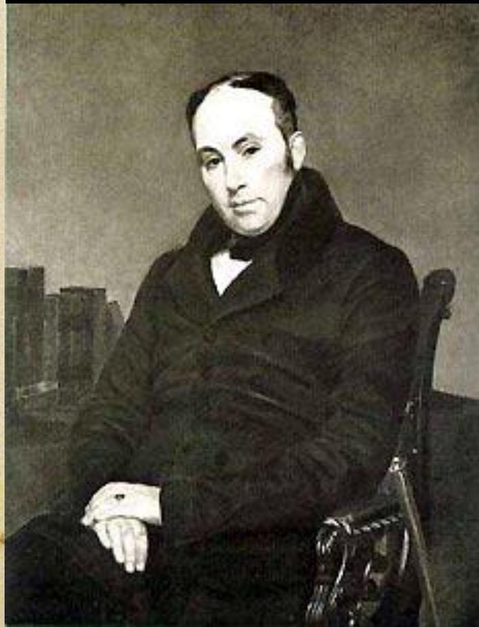
В.А. Жуковский. Художник Е. Эстеррейх. 1820. Портрет подарен Пушкину с надписью: «Победителю-ученику от побежденного учителя в тот высокаторжественный день, в который он окончил свою поэму Руслан и Людмила. 1820. марта 26. Великая пятница»

Победителю-ученику от побежденного учителя в тот высокаторжественный день, в который он окончил свою поэму Руслан и Людмила 1820. марта 26. Великая пятница