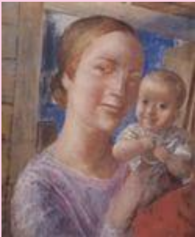
Мать и дитя К. С. Петров- Водкин.