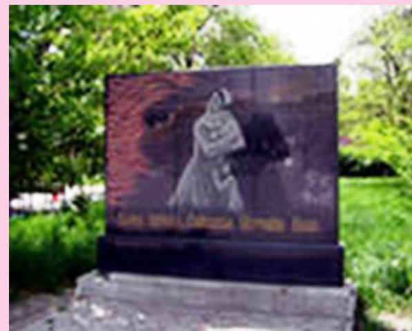
Памятник матерям в Грозном