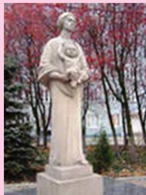
Памятник матери в Донецке