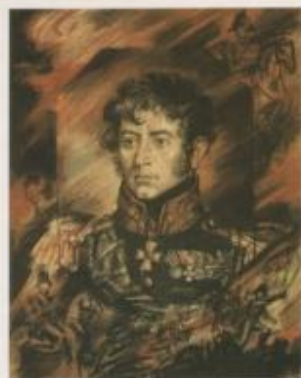
Михаил Андреевич Милорадович 1775—1825