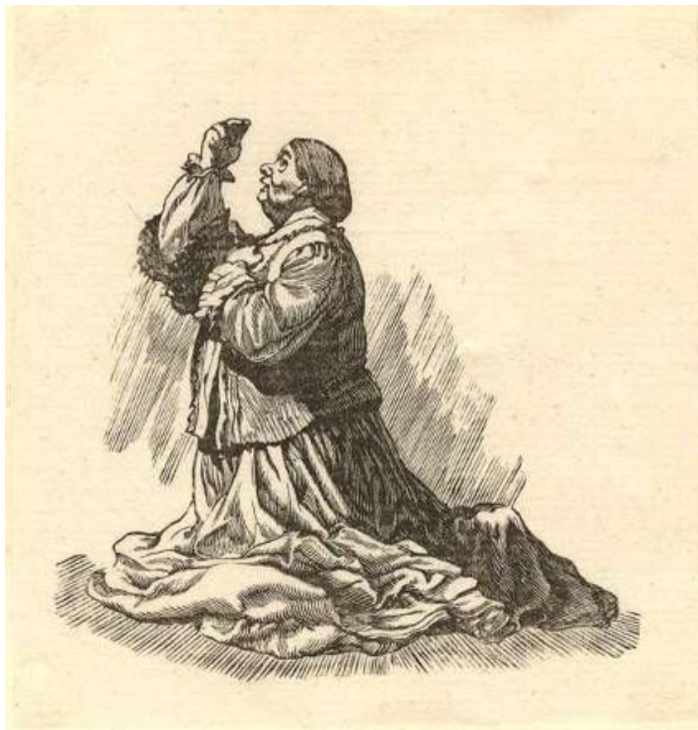
Бабушка Акулина Ивановна. Худ. Б. Дехтерёв.

http://ilyarepin.ru/?type=page&page=cbd48b28-6642-44b2-91d4-4c16b5a6b60f&item=27b2baf6-ad9a-4456-a6f4-95ae041858ad