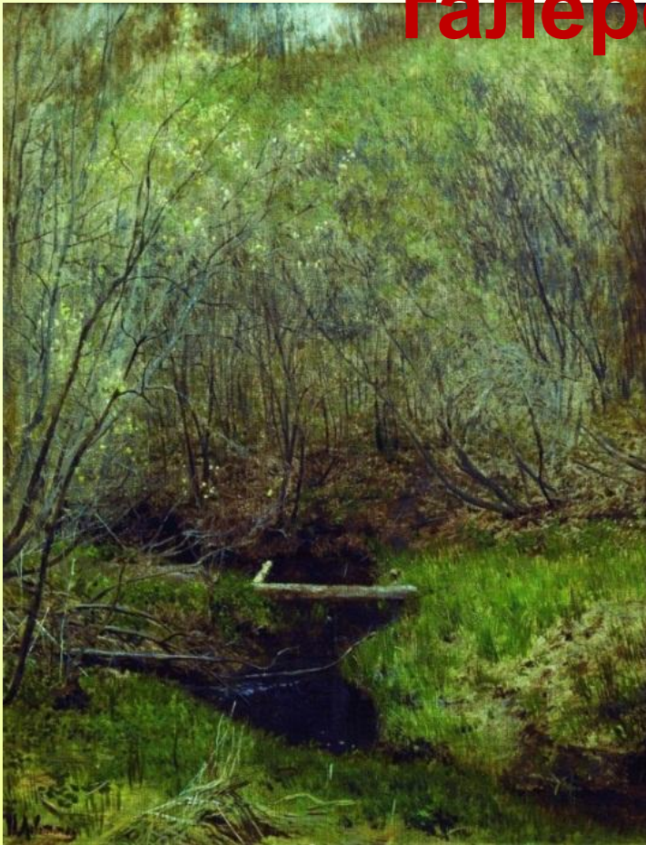
И. И. Левитан «Весна. Ручей в лесу»

Прощай, родная пуща, Прости, златой родник.