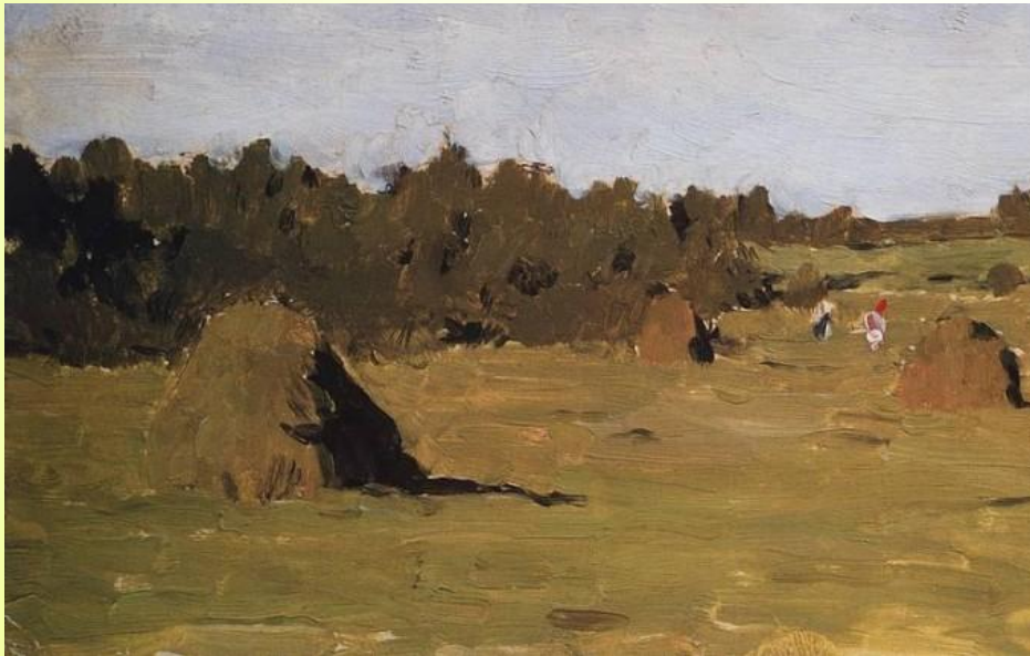
И. И. Левитан «Сенокос»

Край любимый! Сердцу снятся Скирды солнца в водах лонных.