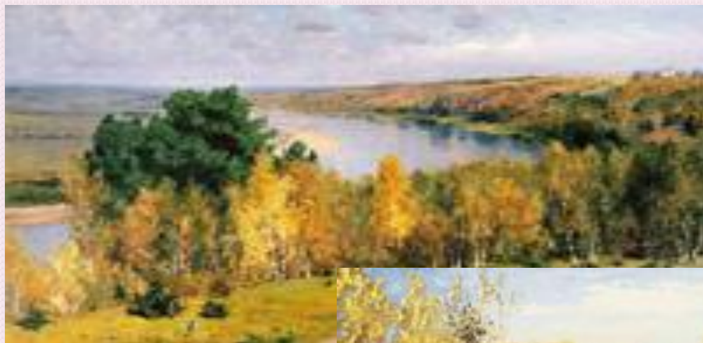
В.Поленов “Золотая осень”