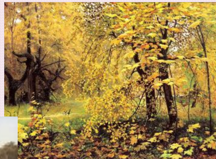
Н.Остроухов “Золотая осень”