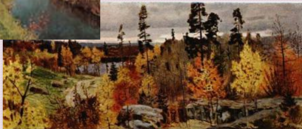
Н.Остроухов “Золотая осень в Карелии”