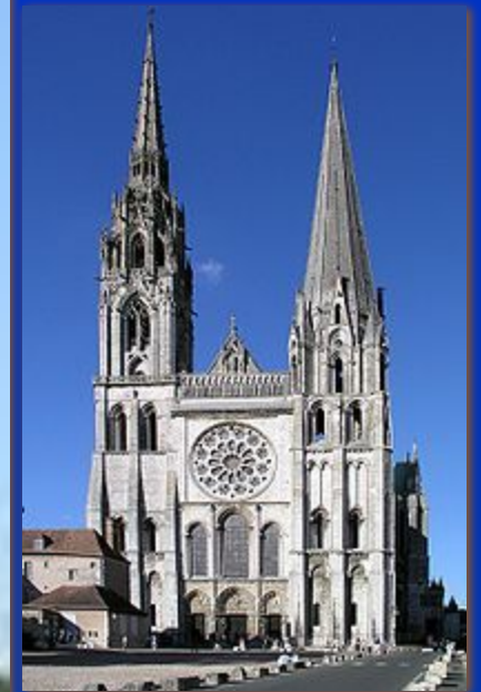
Шартрский собор (Франция)