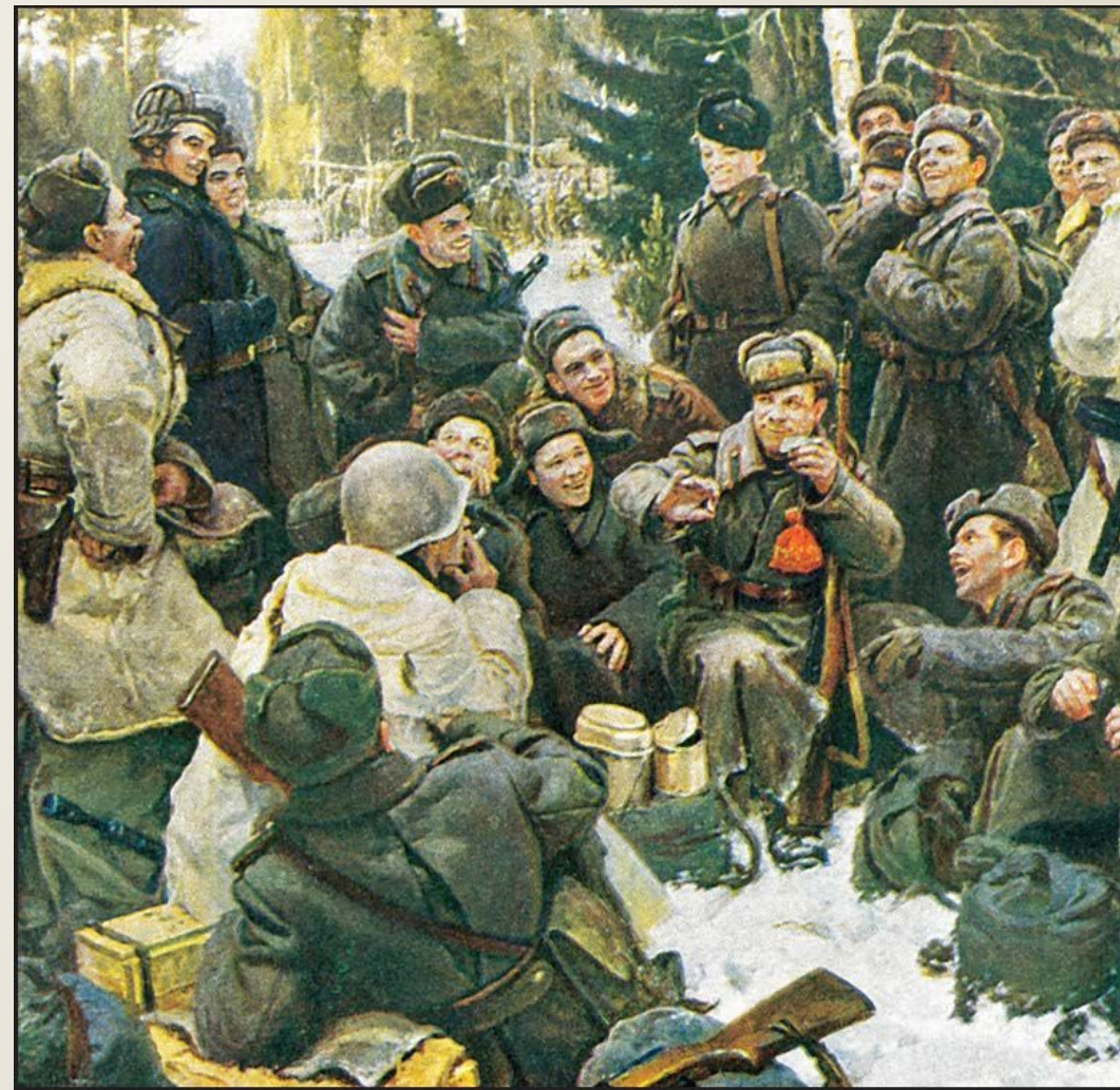
«Отдых после боя». Художник Ю.М. Непринцев. 1951 г.