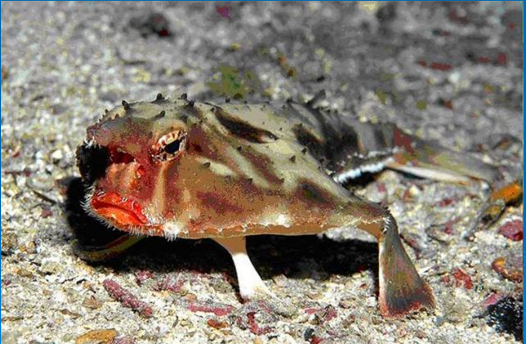
Морская мышь или розовогубый нетопыр