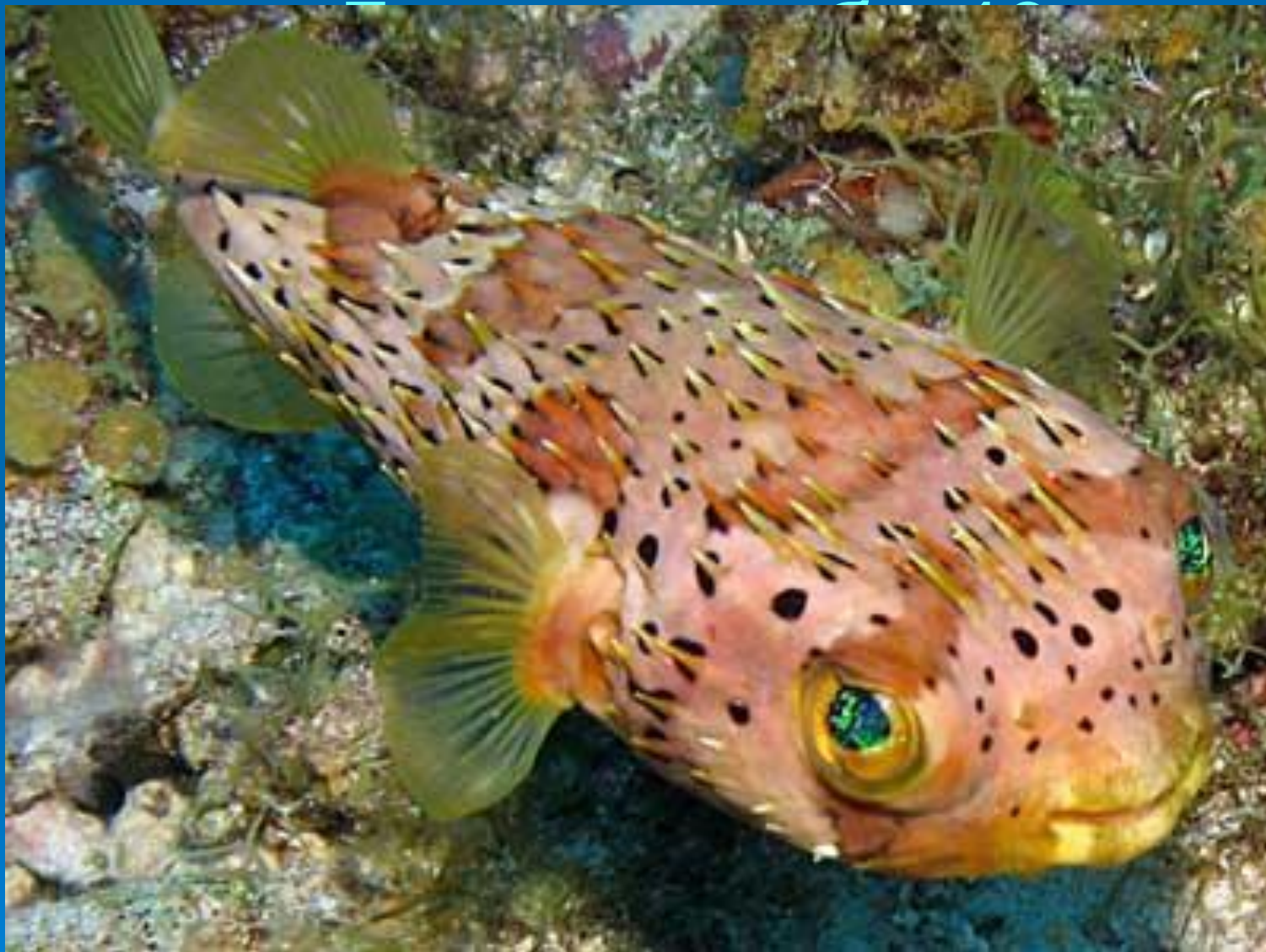
Рыба дикобраз (рыба-шар)