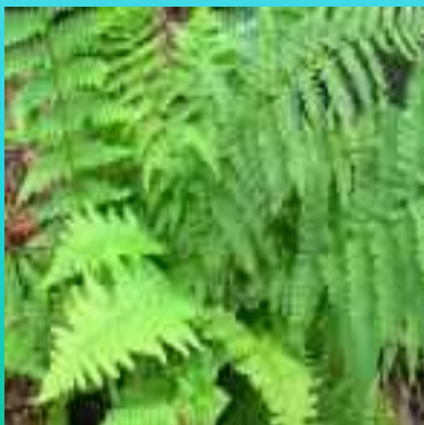
Папоротник Щитовник мужской