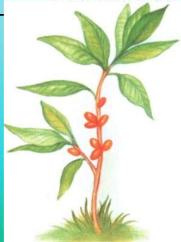
ВОЛЧЬЕ ЛЫКО (ядовитая)

Какое ядовитое растение леса связано с названием животного?