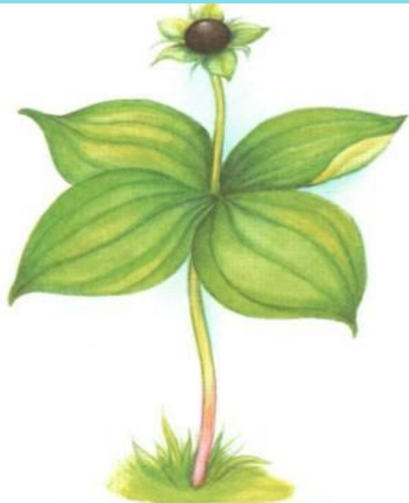
ВОРОНИЙ ГЛАЗ (ядовитая)

Какое ядовитое растение леса связано с названием птицы?