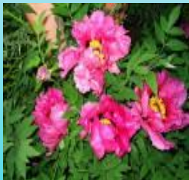
Пион уклоняющийся- Марьин корень