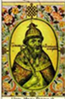
Царь Иван Грозный