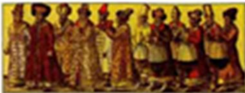
Русское посольство к германскому императору