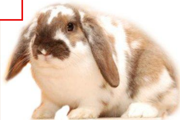
Порода вислоухий баран