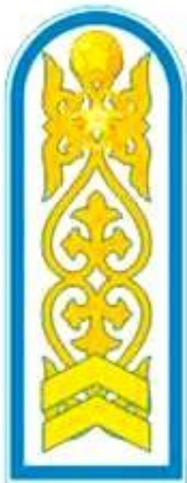
Младший сержант к рубашке белого цвета