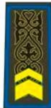
Сержант третьего класса