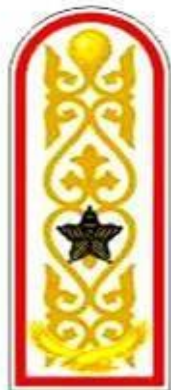
Генерал-майор к рубашке белого цвета