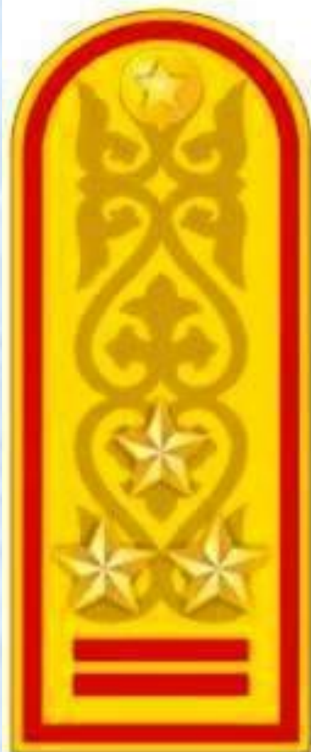
Полковник к парадному мундиру и пальто