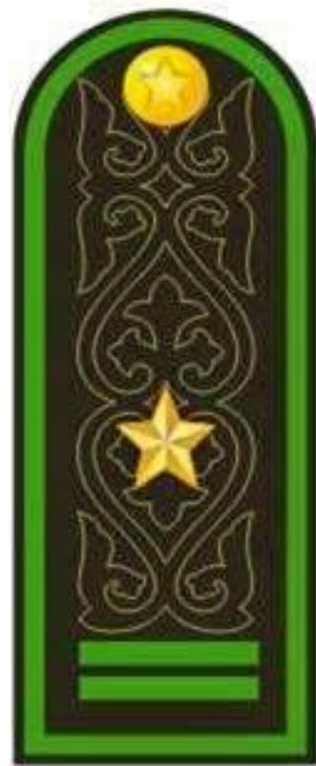
Майор к повседневному кителю и пальто