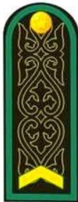
Ефрейтор к повседневному костюму и пальто