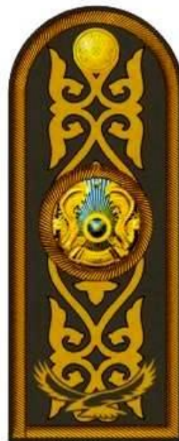
к повседневному кителю и рубашке бежевого цвета