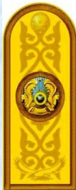
к парадному мундиру и пальто