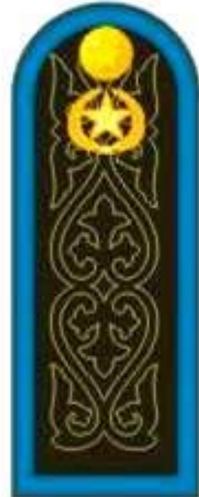
Рядовой к куртке и рубашке бежевого цвета