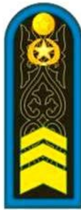
Сержант второго класса