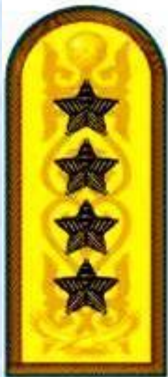
Генерал армии к парадному мунициру