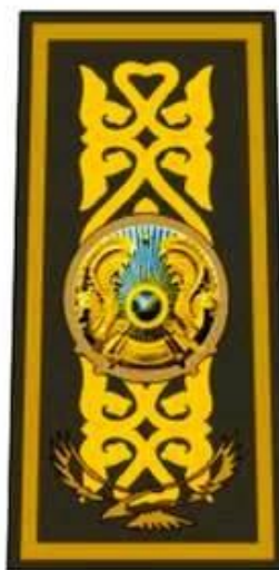
к свитеру, куртке демисезонной