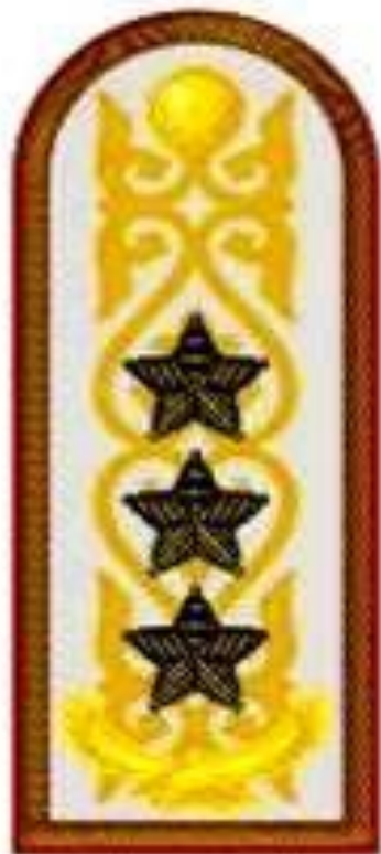
Генерал-полковник к парадному мунициру и пальто