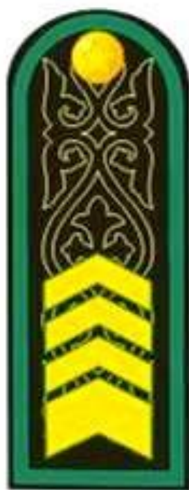
Сержант первого класса