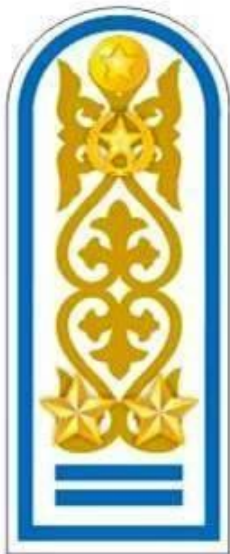
Подполковник к рубашке белого цвета