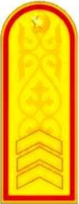
Сержант к парадному мундиру и пальто