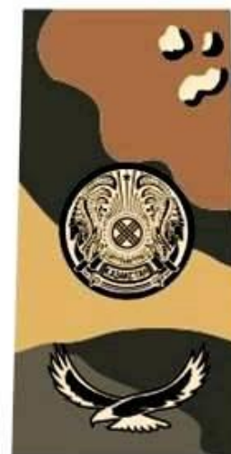
к полевому обмундированию