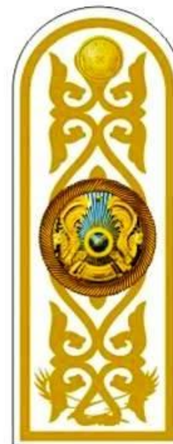
к рубашке белого цвета