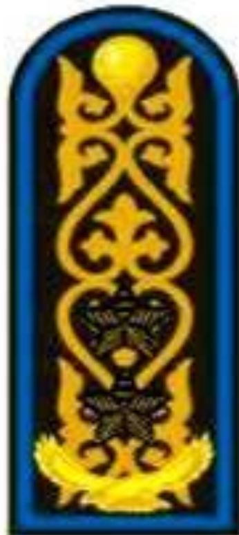
Генерал-лейтенант к повседневному югелю, плащу и пальто