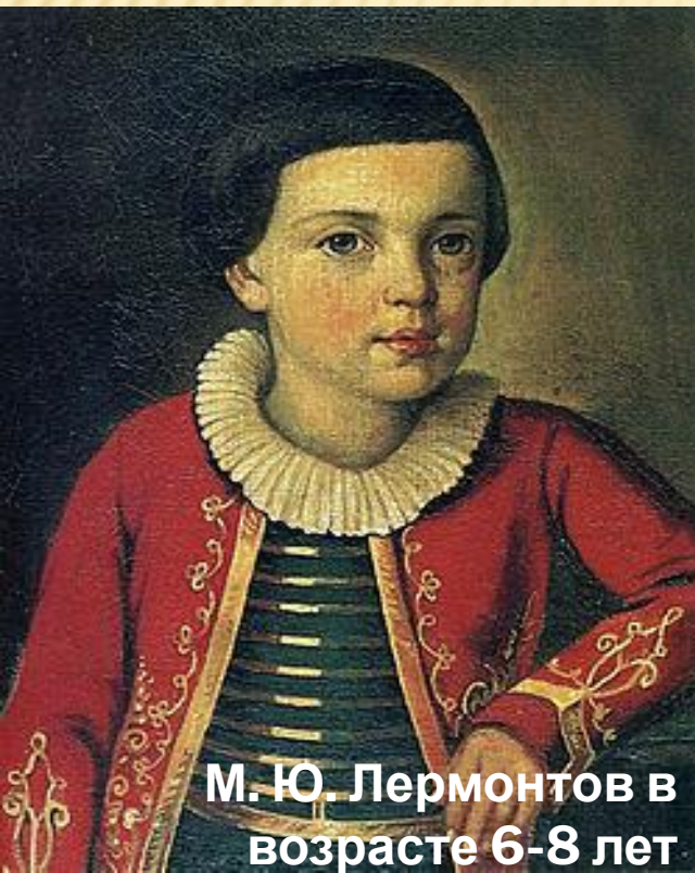
М. Ю. Лермонтов в возрасте 6-8 лет