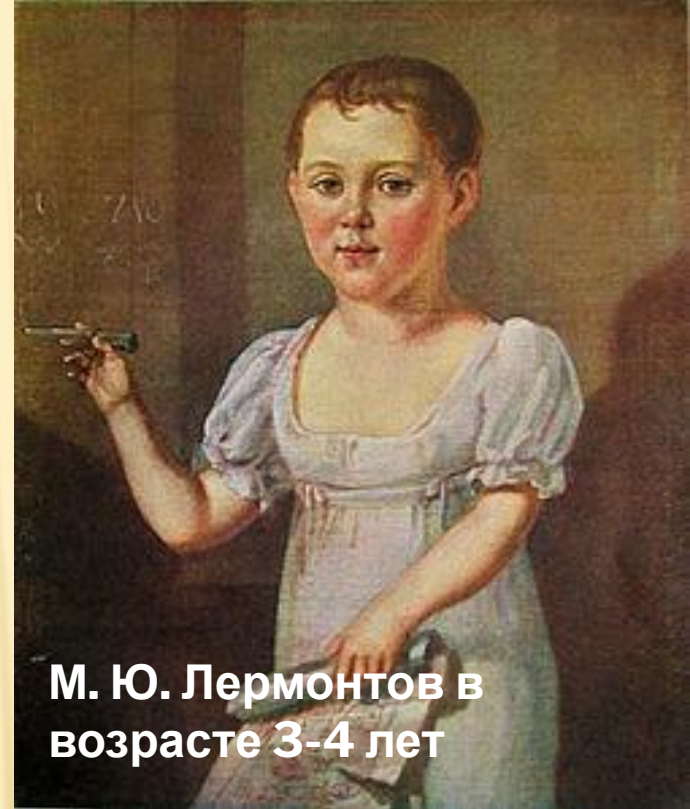
М. Ю. Лермонтов в возрасте 3-4 лет