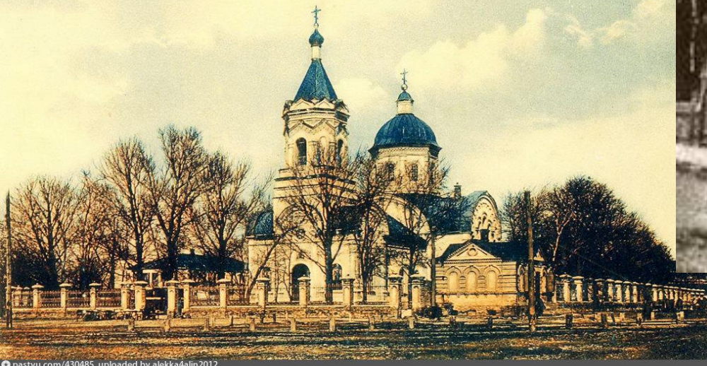
Екатеринославъ. Покровская Церковь