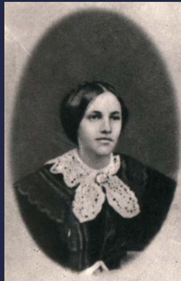
Толстая Мария Николаевна (сестра Льва Толстого)