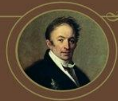
Н. М. Карамзин

Ее политическом и гражданском отношениях». Карамзин представил консервативные слои общества, выразил их мнение относительно либеральных Реформ императора. Писатель творчеством пытался доказать, что Россия не нуждается в преобразованиях. Эта работа представляет набросок к масштабному труду.