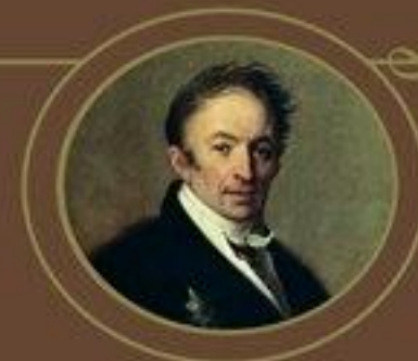
Н. М. Карамзин

Ее политическом и гражданском отношениях». Карамзин представил консервативные слои общества, выразил их мнение относительно либеральных Реформ императора. Писатель творчеством пытался доказать, что Россия не нуждается в преобразованиях. Эта работа представляет набросок к масштабному труду.