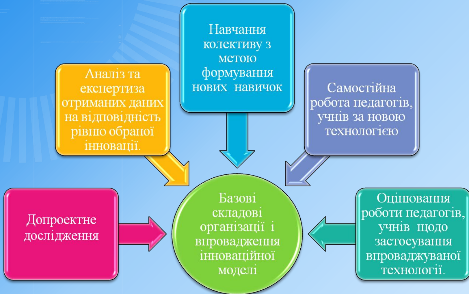
Схема впровадження інноваційних технологій