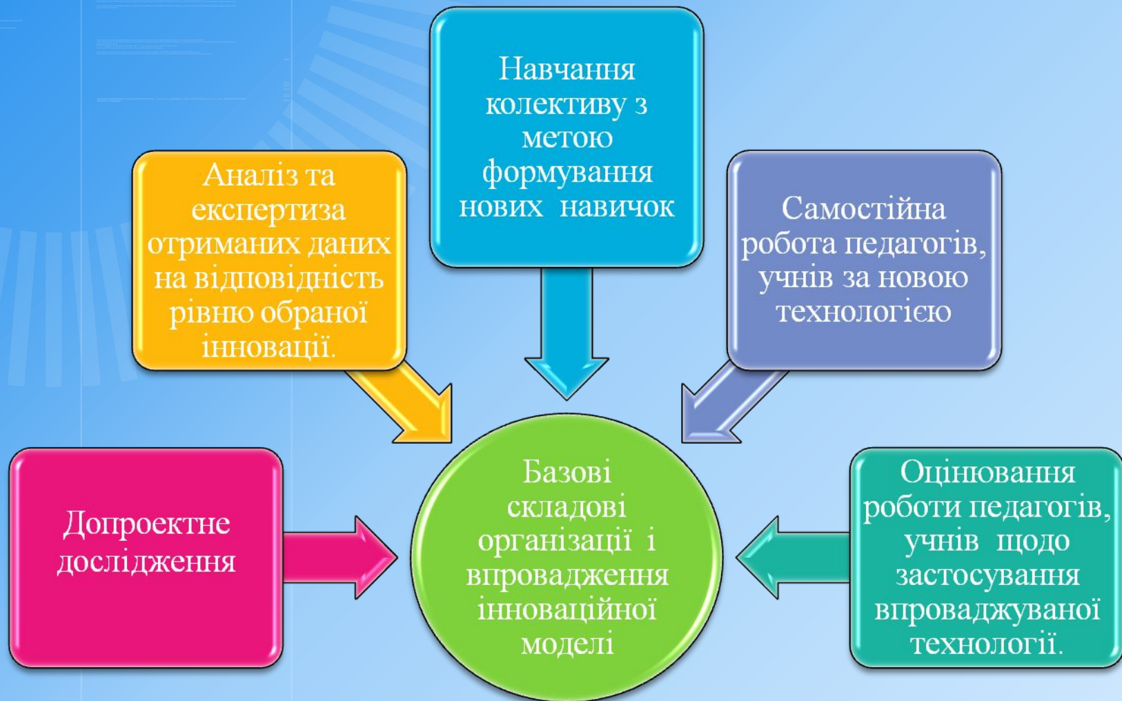
Схема впровадження інноваційних технологій