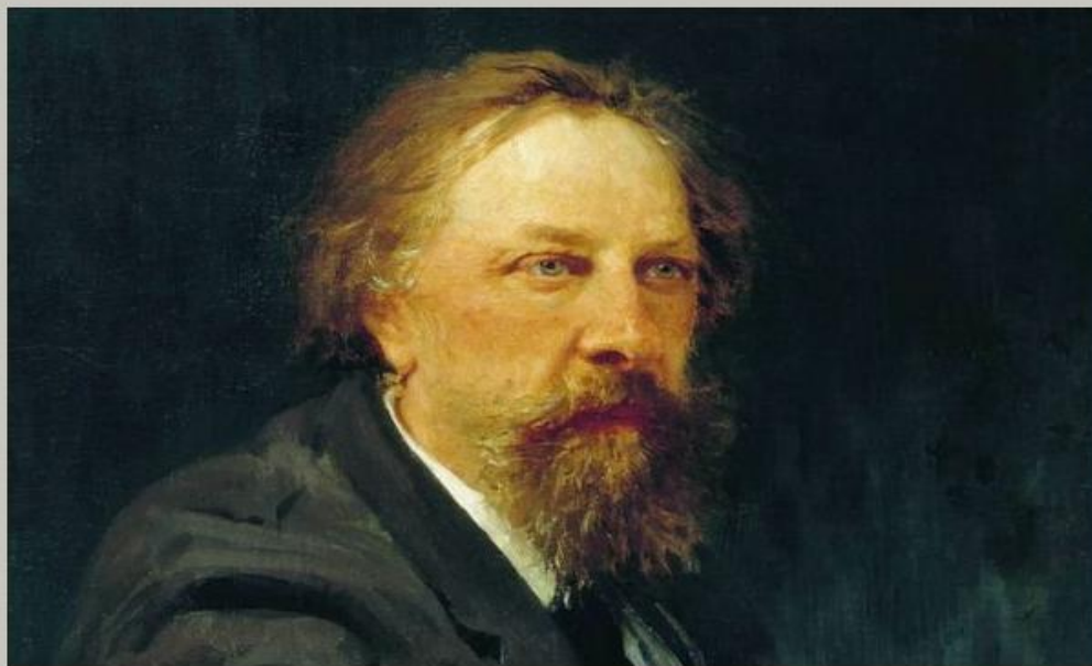
Алексей Константинович Толстой (1817 – 1875 )