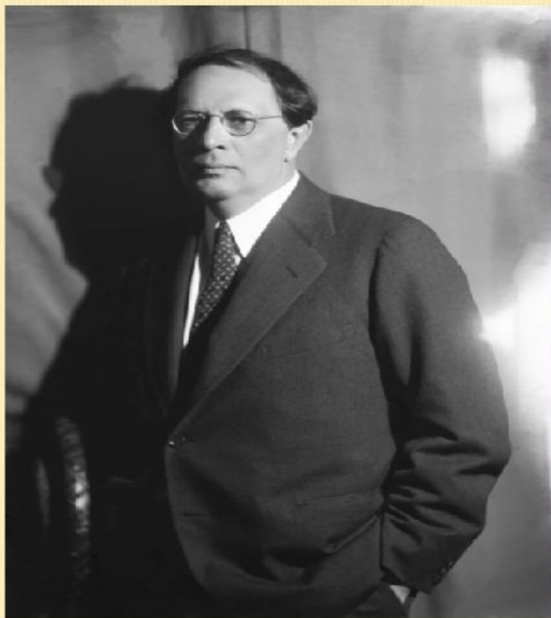
Алексей Николаевич Толстой (1883 - 1945)