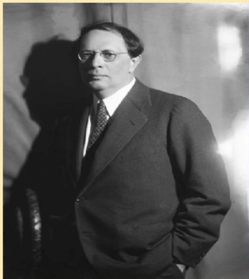
Алексей Николаевич Толстой (1883 - 1945)