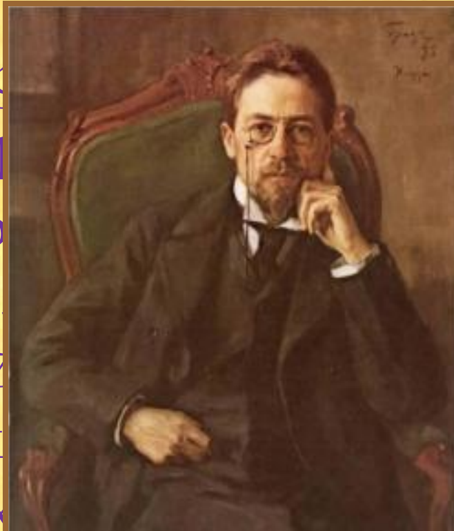
А. П. Чехов

Первые пр (29 января публикую «Стреко пародий «Что ча повестях