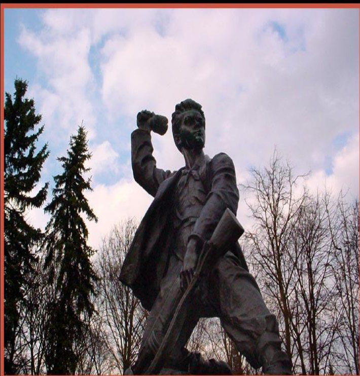
Памятник Марату Казею