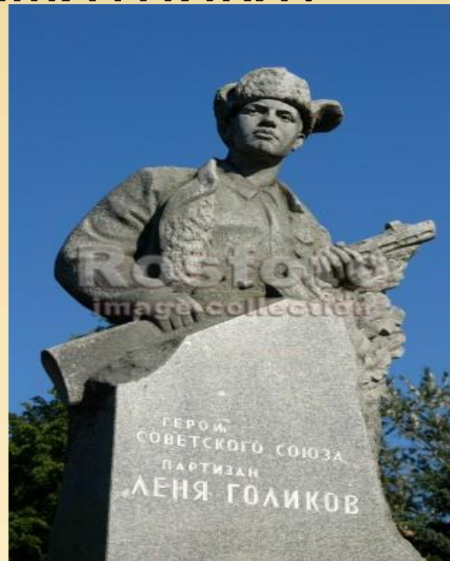
Памятник Лёне Голикову