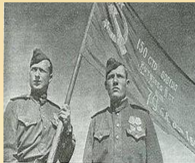
Артиллеристы 756-го полка 150-й стрелковой дивизии М. А. Егоров (справа) и А. В. Кантария со Знаменем Победы, Берлин, Май 1945.