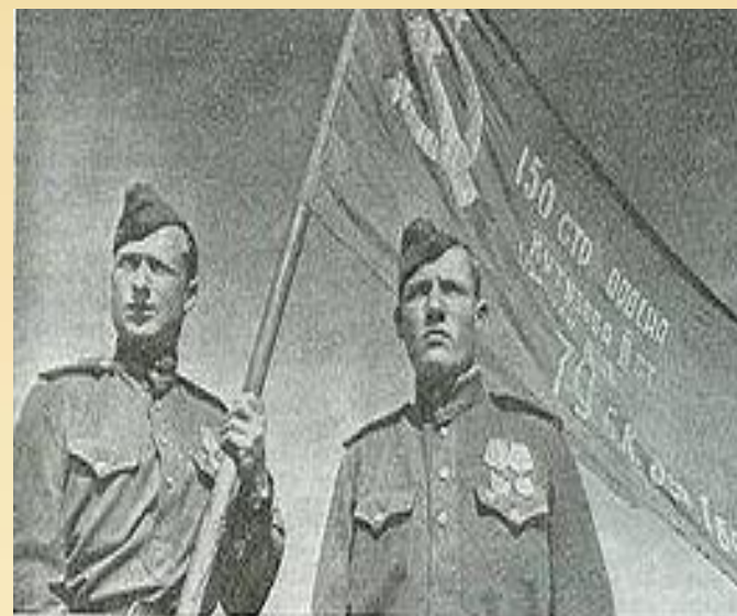
Артиллеристы 756-го полка 150-й стрелковой дивизии М. А. Егоров (справа) и А. В. Кантария со Знаменем Победы, Берлин, Май 1945.