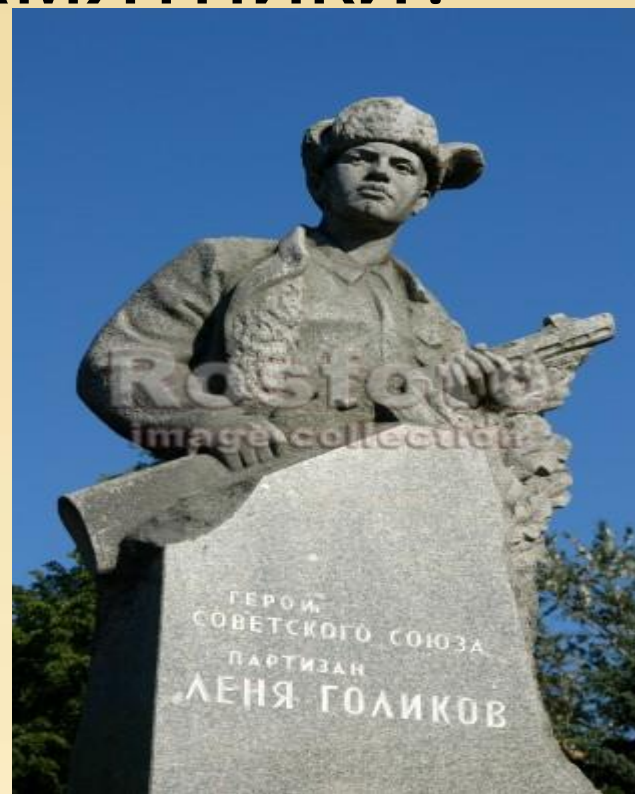
Памятник Лёне Голикову