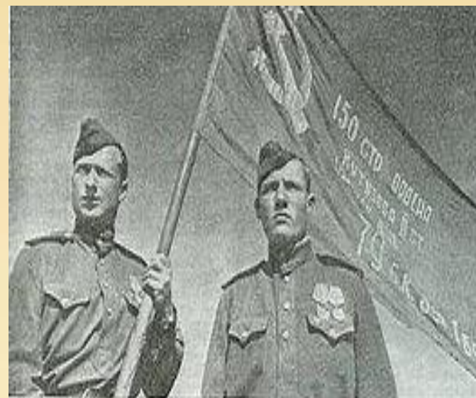
Артиллеристы 756-го полка 150-й стрелковой дивизии М. А. Егоров (справа) и М. В. Кантария со Знаменем Победы, Берлин, Май 1945.