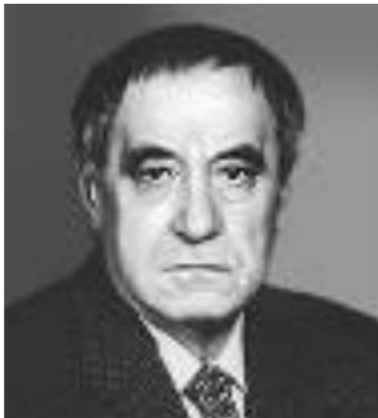
В. Катаев (1897 – 1986)