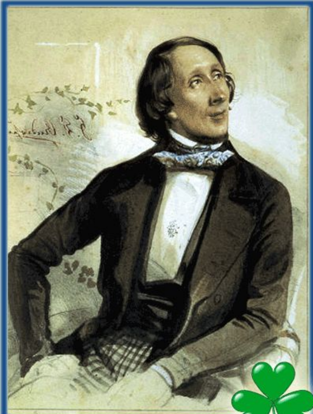
Ганс Христиан Андерсен