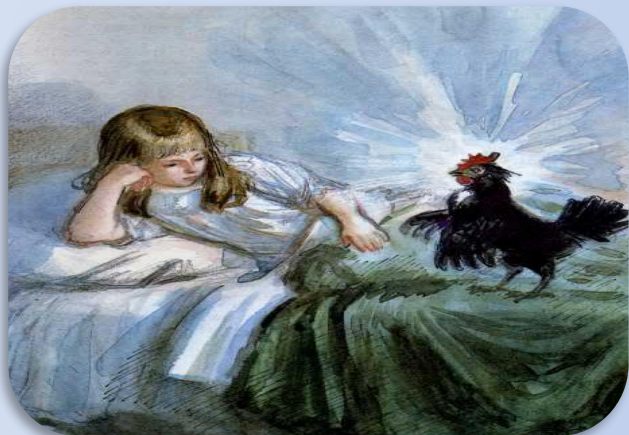
Погорельский «Чёрная курица, или подземные жители»