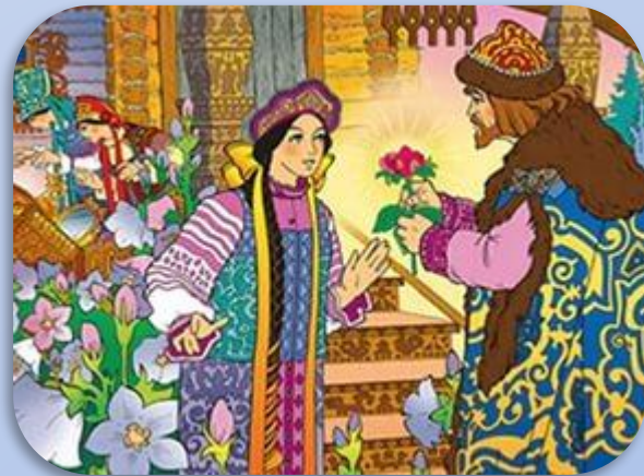
Аксаков «Аленький цветочек»