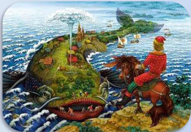
Ершов «Конёк – горбунок»