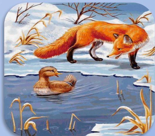
Мамин- Сибиряк «Серая Шейка»