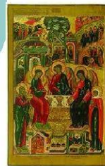
Бог троицу любит