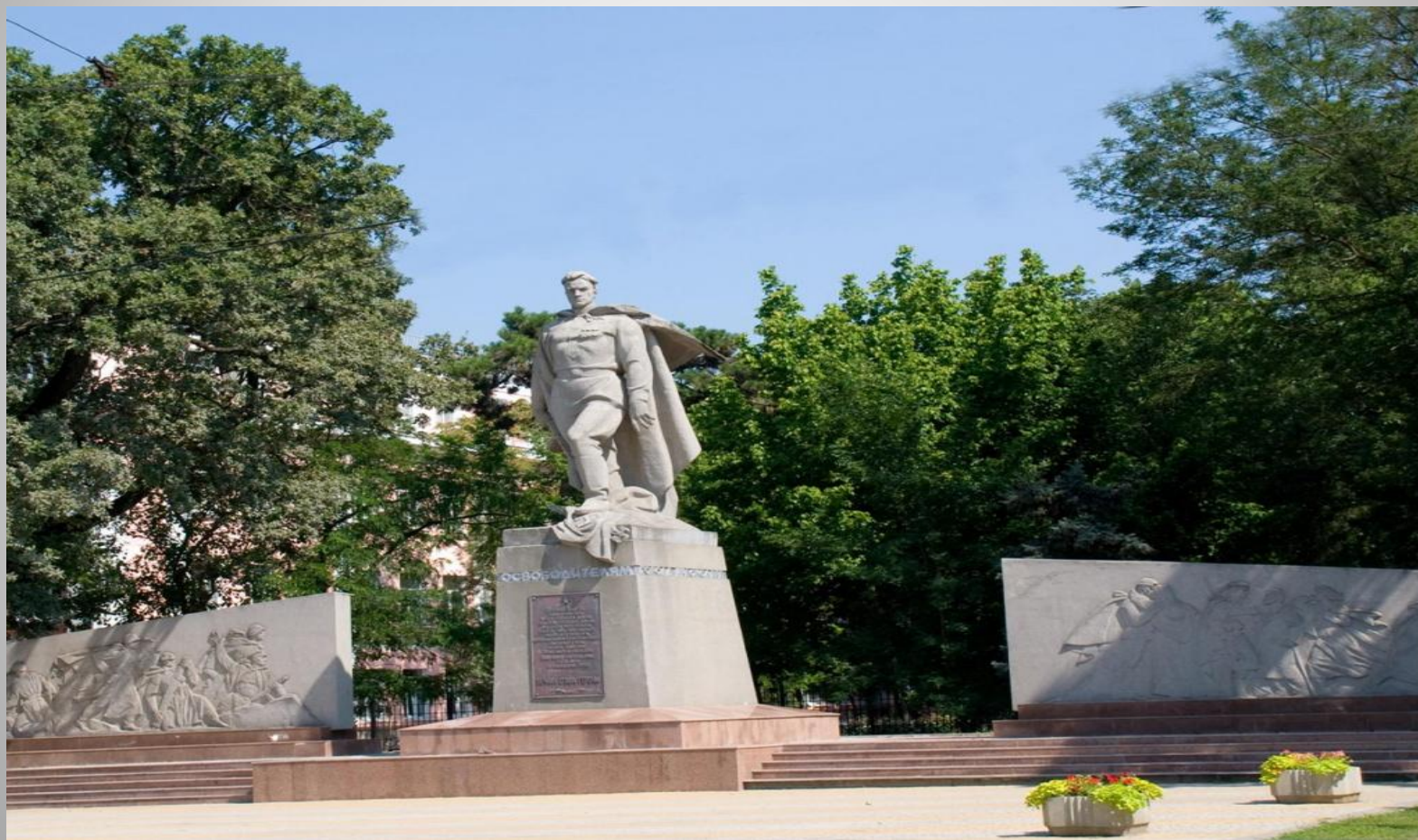
Скульптор - И. П. Шмагун. Архитектор - Е. Г. Лашук.