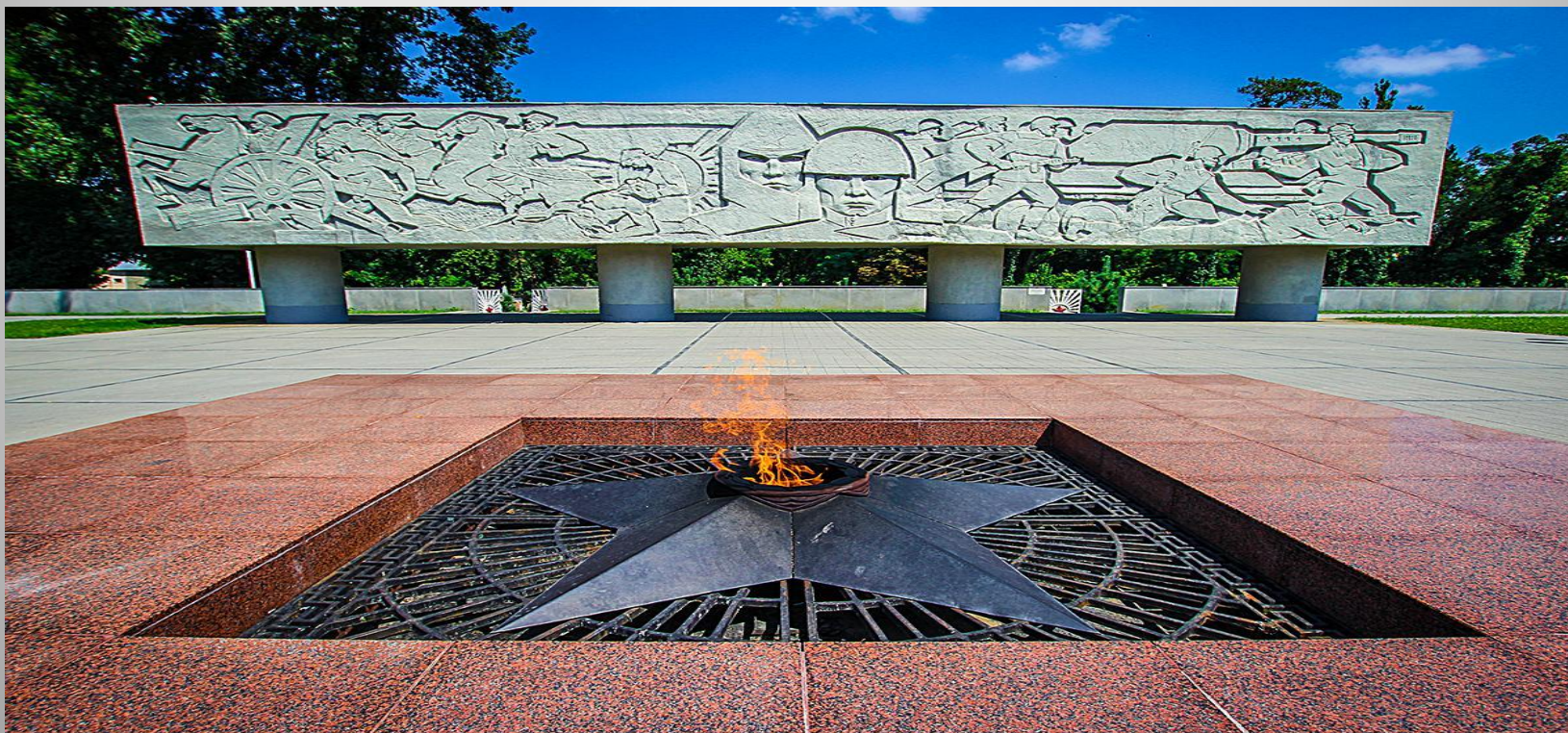
Сооружен по проекту скульптора И.П.Шмагуна. Архитекторы – В.Т.Головеров и Н.Шлыков.

Краснодарцы ценят подвиги героев, погибших в борьбе за Советскую власть и в боях за Родину в годы ВОВ. В память о них на площади Памяти героев на улице Северной в канун 50-летия Советской власти торжественно был открыт мемориальный комплекс «Вечный огонь».