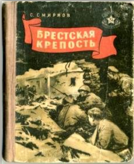
С. С. Смирнов "Брестская крепость"