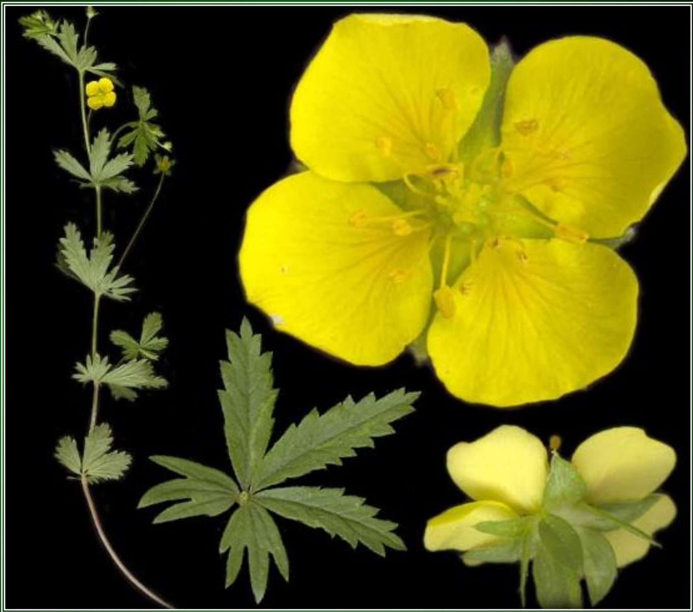
Класс Двудольные - Dicotyledoneae, Семейство Розоцветные - Rosaceae, Род Лапчатка - Potentilla L. Лапчатка прямостоячая - Potentilla erecta .