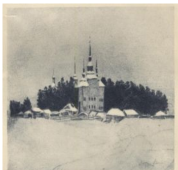
В. Г. Короленко.

На пути из ссылки. Гор. Киренск. (4 января 1894).