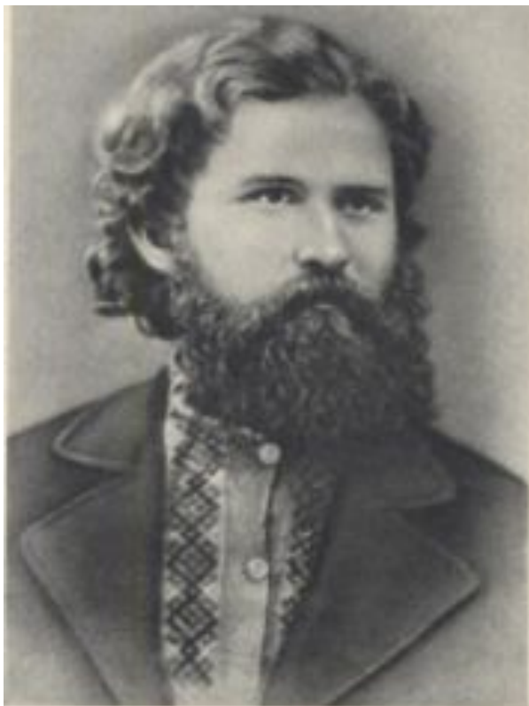
В. Г. Короленко в годы каторжной ссылки (1882)