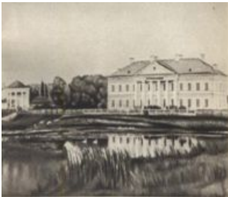
Реальная гимназия в Ростове, в которой учился В. Г. Короленко