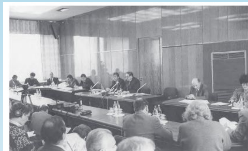
Первое заседание ЦИК. Октябрь 1993 года

Голосование на выборах в Совет Федерации и Государственную Думу проводится одновременно со всенародным голосованием по проекту новой Конституции Российской Федерации – 12 декабря 1993 года.