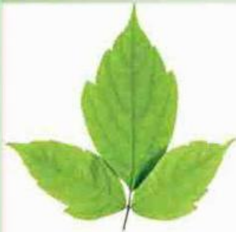
сложный лист ясеня