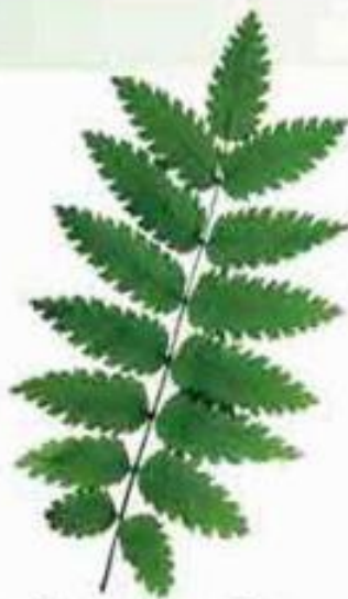
сложный лист рябины