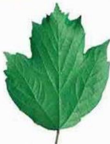
простой лист калины