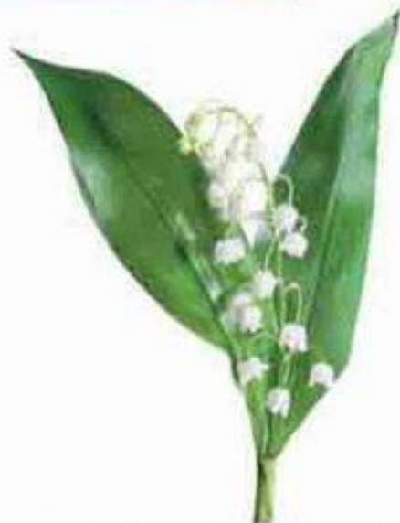
простой лист ландыша