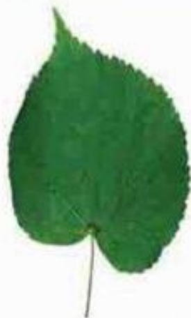
простой лист липы