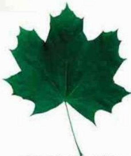
простой лист клёна