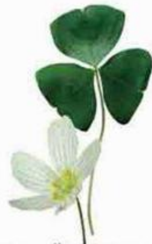
сложный лист кислицы