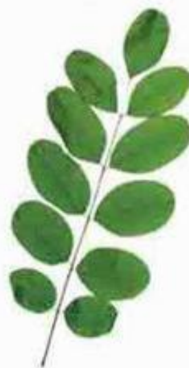
сложный лист акации