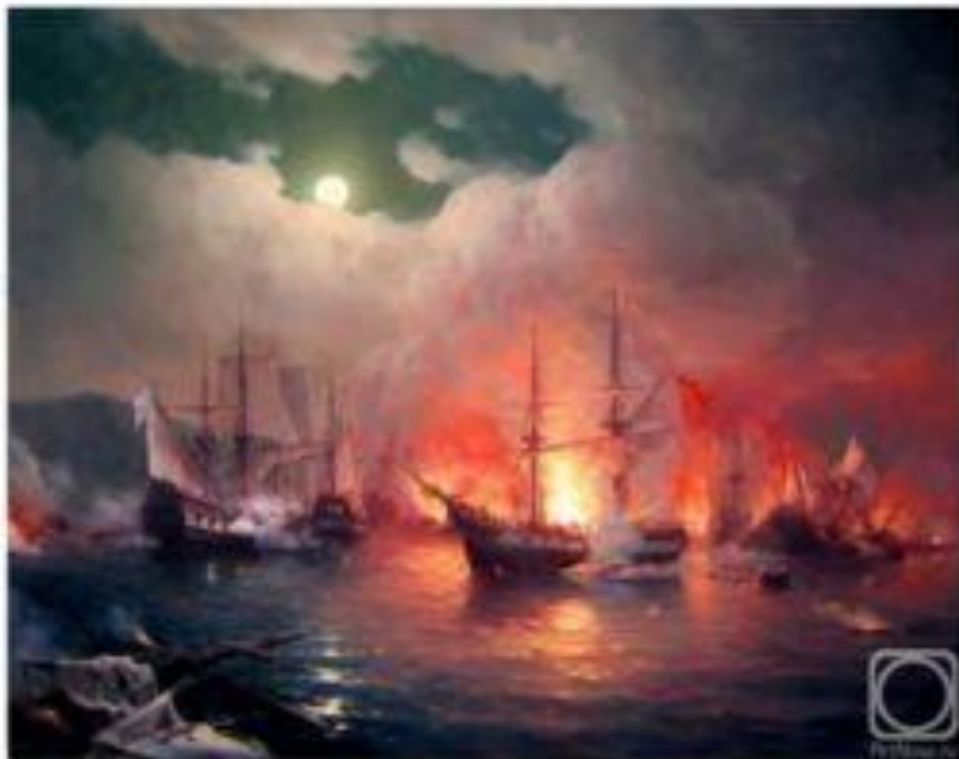
Битва при Синопе - Прядко Юрий Юрьевич -