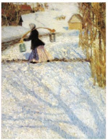
Игорь ГРАБАРЬ. Мартовский снег