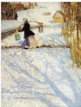
Игорь ГРАБАРЬ. Мартовский снег