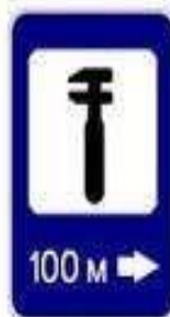
100 м → 7.4 Техническое обслуживание автомобилей