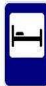
7.9 Гостиница или мотель