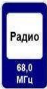
68,0 МГц 7.15 Зона приёма радиостанции, передающей информацию о дорожном движении