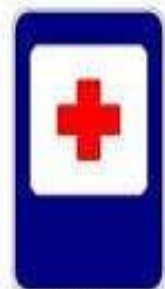
7.1 Пункт медицинской помощи