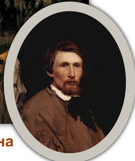
Виктор Михайлович Васнецов «Витязь на распутье»