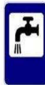
7.8 Питьевая вода