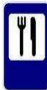
7.7 Пункт питания