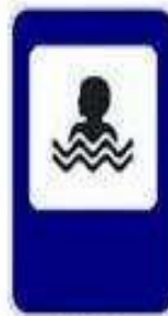
7.17 Бассейн или пляж