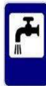
7.8 Питьевая вода