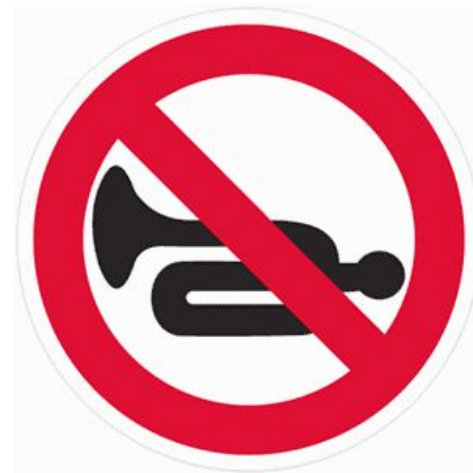
Подача звукового сигнала запрещена