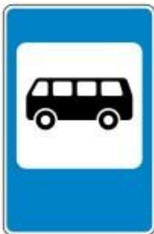
Место остановки автобуса