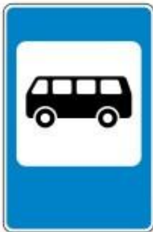
Место остановки автобуса