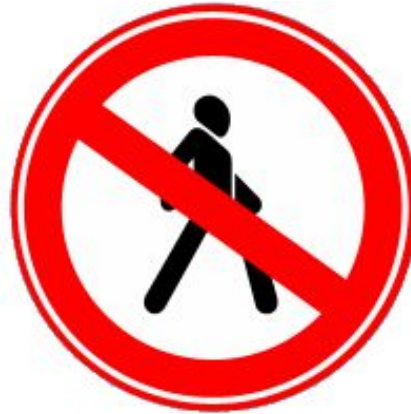
Движение пешеходов запрещено