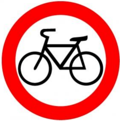
Движение на велосипедах запрещено