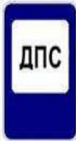
7.12 Пост дорожно- патрульной службы