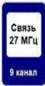
Связь 27 МГц 9 канал 7.16 Зона радиосвязи с аварийными службами