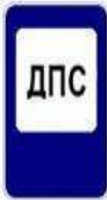
7.12 Пост дорожно- патрульной службы