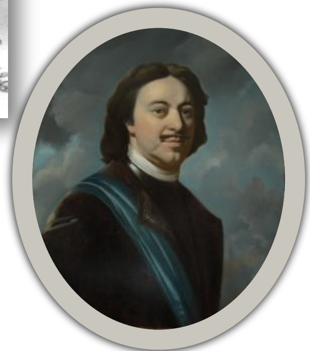
Пётр Алексеевич Романов