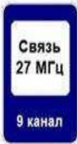
9 канал 7.16 Зона радиосвязи с аварийными службами