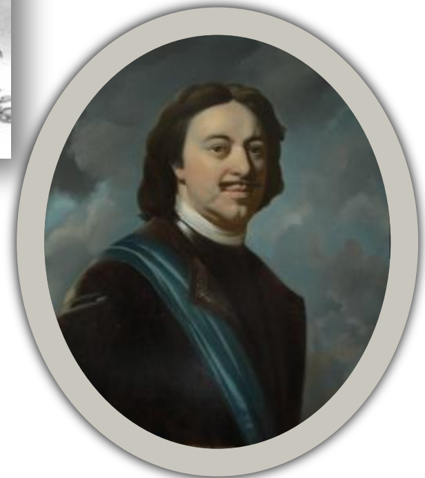
Пётр Алексеевич Романов