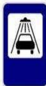
7.5 Мойка автомобилей