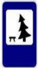
7.11 Место отдыха