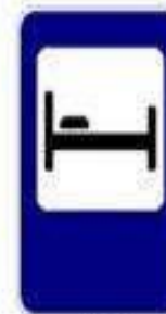
7.9 Гостиница или мотель