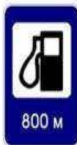
800 м 7.3 Авто- заправочная станция