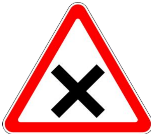
Пересечение равнозначных дорог