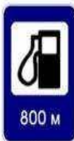
800 м 7.3 Авто- заправочная станция