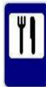
7.7 Пункт питания