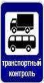
транспортный контроль 7.14 Пункт контроля международных автомобильных перевозок