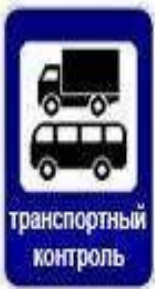
транспортный контроль 7.14 Пункт контроля международных автомобильных перевозок