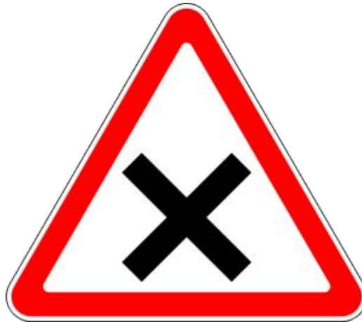
Пересечение равнозначных дорог