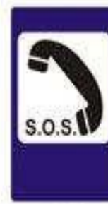
S.O.S. 7.19 Телефон экстренной связи