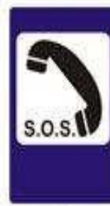
7.19 Телефон экстренной связи