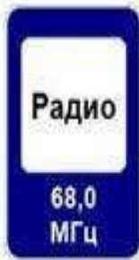
68,0 МГц 7.15 Зона приёма радиостанции, передающей информацию о дорожном движении