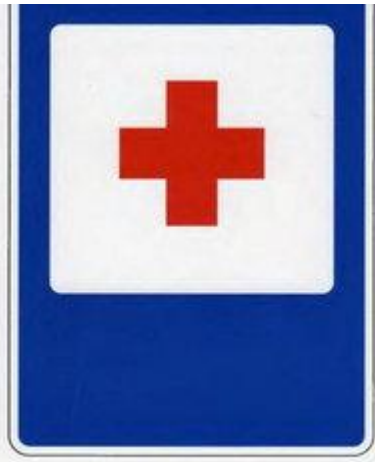
Пункт первой медицинской помощи