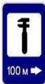
100 м → 7.4 Техническое обслуживание автомобилей