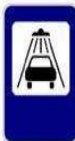
7.5 Мойка автомобилей