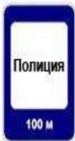
100 м 7.13 Полиция