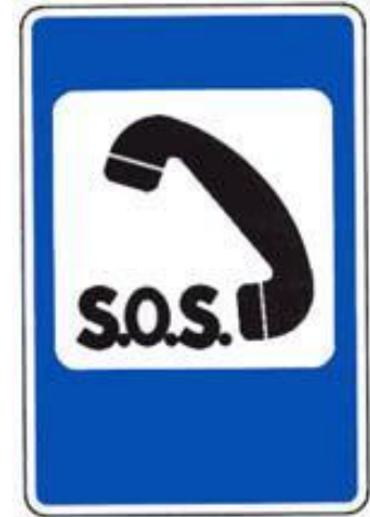
Телефон экстренных служб