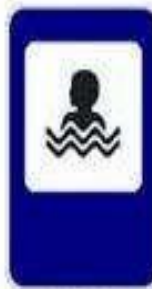
7.17 Бассейн или пляж