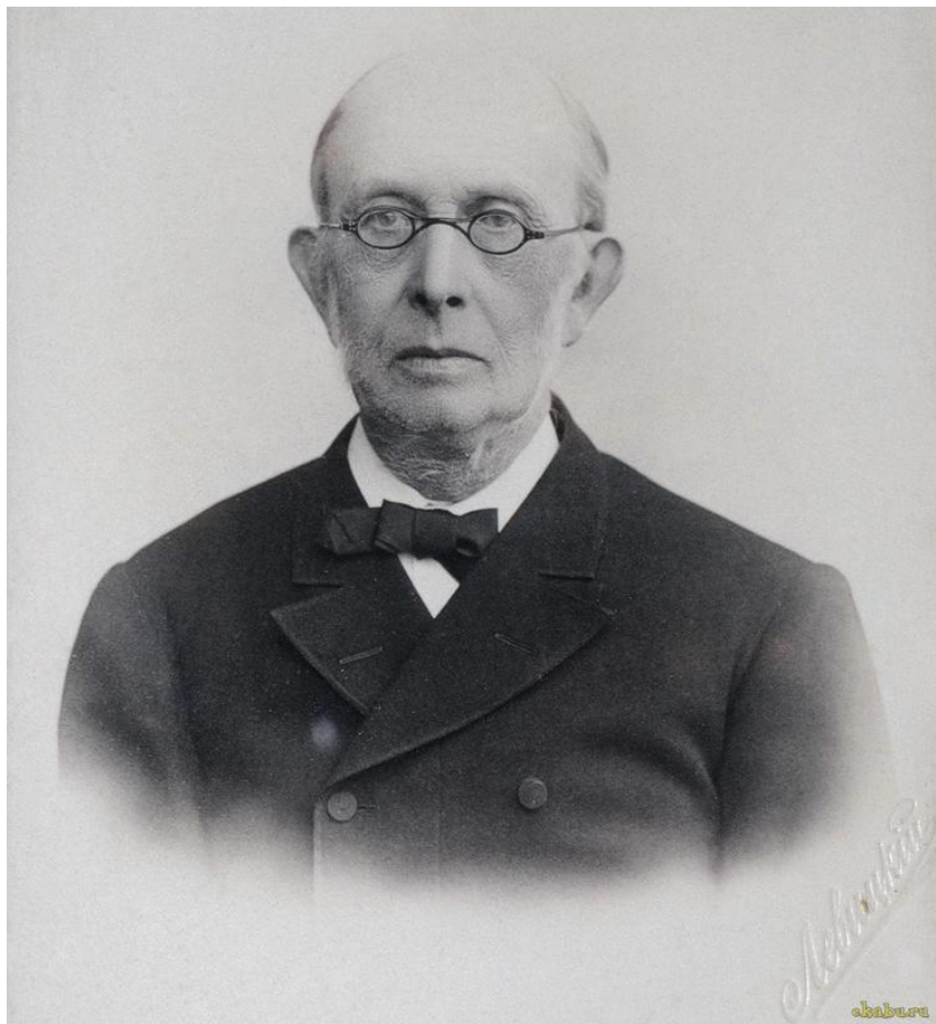
Константин Петрович Победоносцев