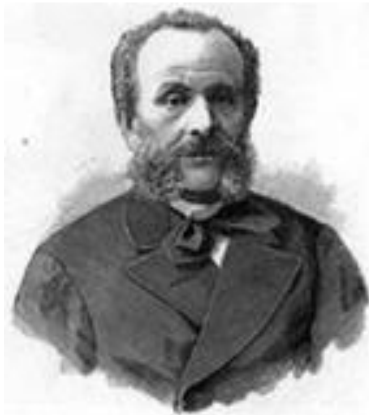
Гирс Николай Карлович 1883-1895