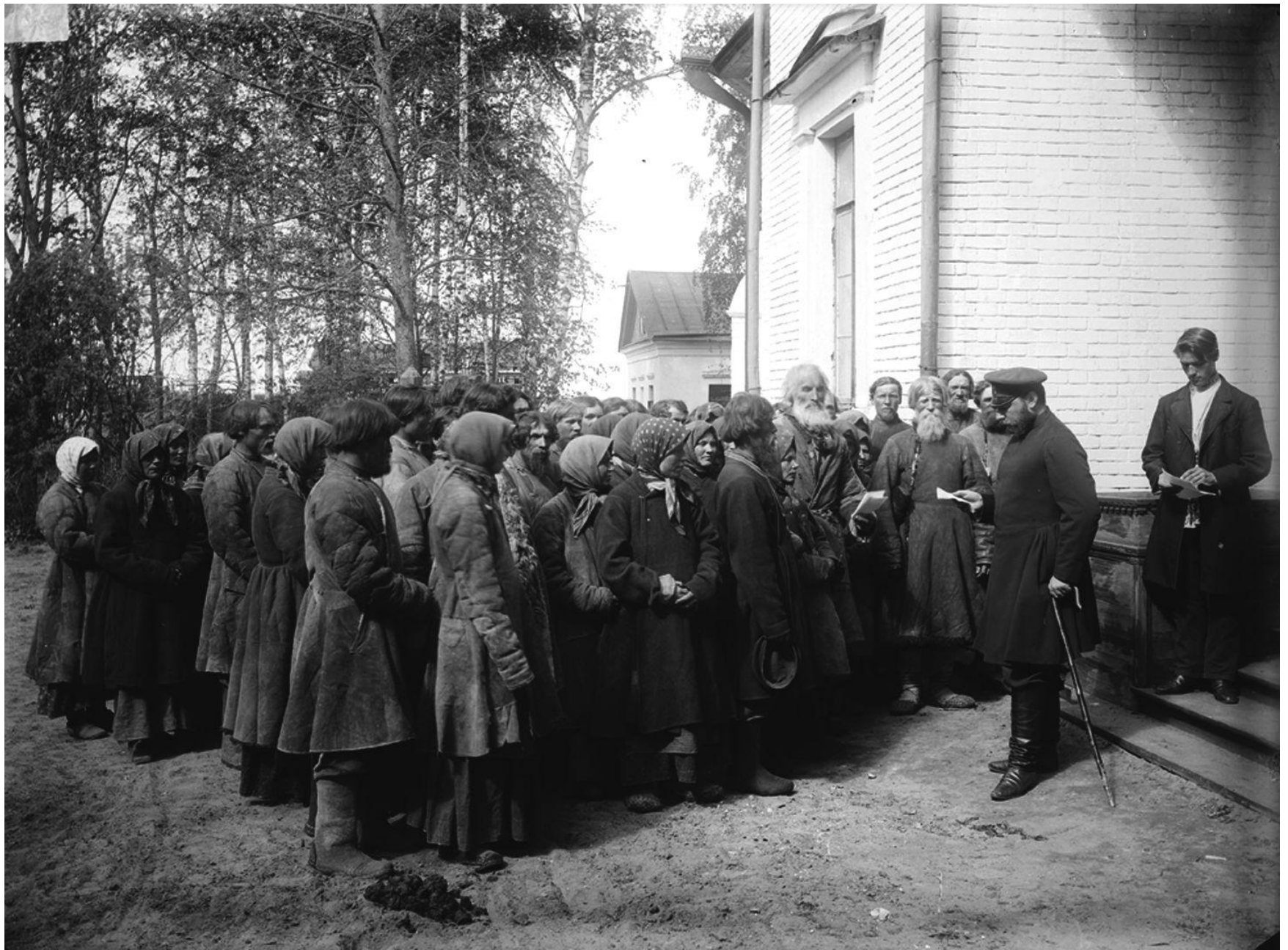
Крестьяне у земского начальника