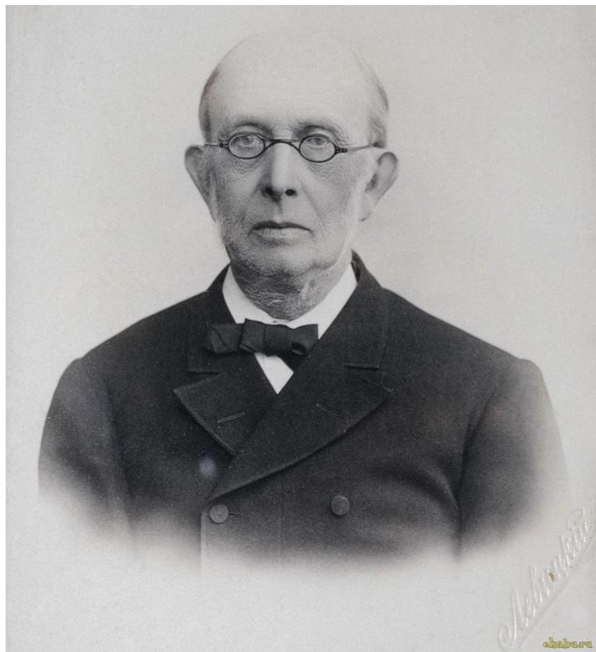
Константин Петрович Победоносцев