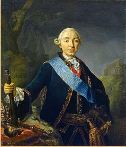
Петр III – отец Павла I

Павел I- сын Петра III и Екатерины II. Родился 20 сентября (1 октября) 1754 г.