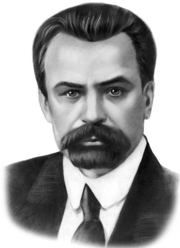
Володимир Винниченко (1880—1951)