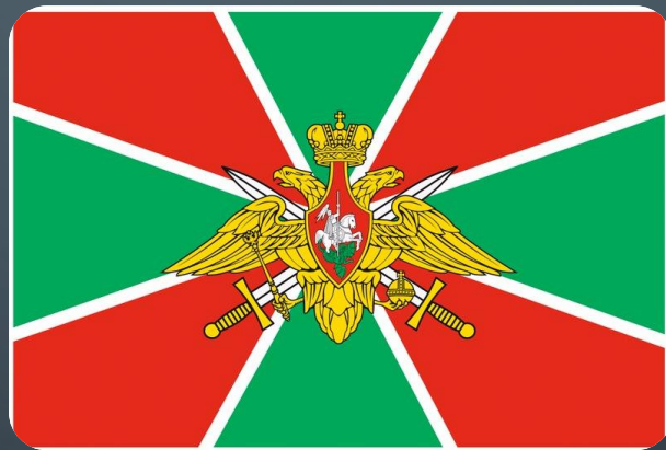
ПОГРАНИЧНЫЕ ВОЙСКА РФ ВОЙСКА ГРАЖДАНСКОЙ ОБОРОНЫ