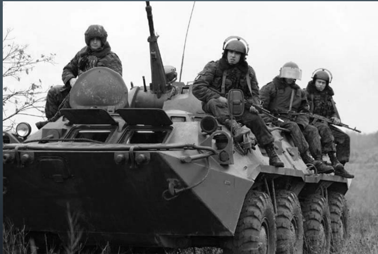
Служащие и работники внутренних войск МВД РФ в Чечне.

6.ОДНА ИЗ ВАЖНЕЙШИХ ЗАДАЧ ВНУТРЕННИХ ВОЙСК СОСТОИТ В ТОМ, ЧТОБЫ СОВМЕСТНО С ВООРУЖЕННЫМИ СИЛАМИ ПО ЕДИНОМУ ЗАМЫСЛУ И ПЛАНУ УЧАСТВОВАТЬ В СИСТЕМЕ ТЕРРИТОРИАЛЬНОЙ ОБОРОНЫ СТРАНЫ.