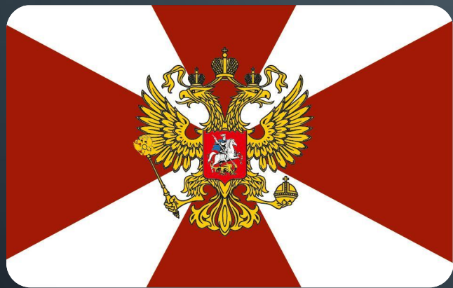
ВНУТРЕННИЕ ВОЙСКА МВД

К ВОЙСКАМ, НЕ ВХОДЯЩИМ В ВИДЫ И РОДА ВОЙСК ВООРУЖЕННЫХ СИЛ, ОТНОСЯТСЯ ПОГРАНИЧНЫЕ ВОЙСКА, ВНУТРЕННИЕ ВОЙСКА МВД РОССИИ, ВОЙСКА ГРАЖДАНСКОЙ ОБОРОНЫ.