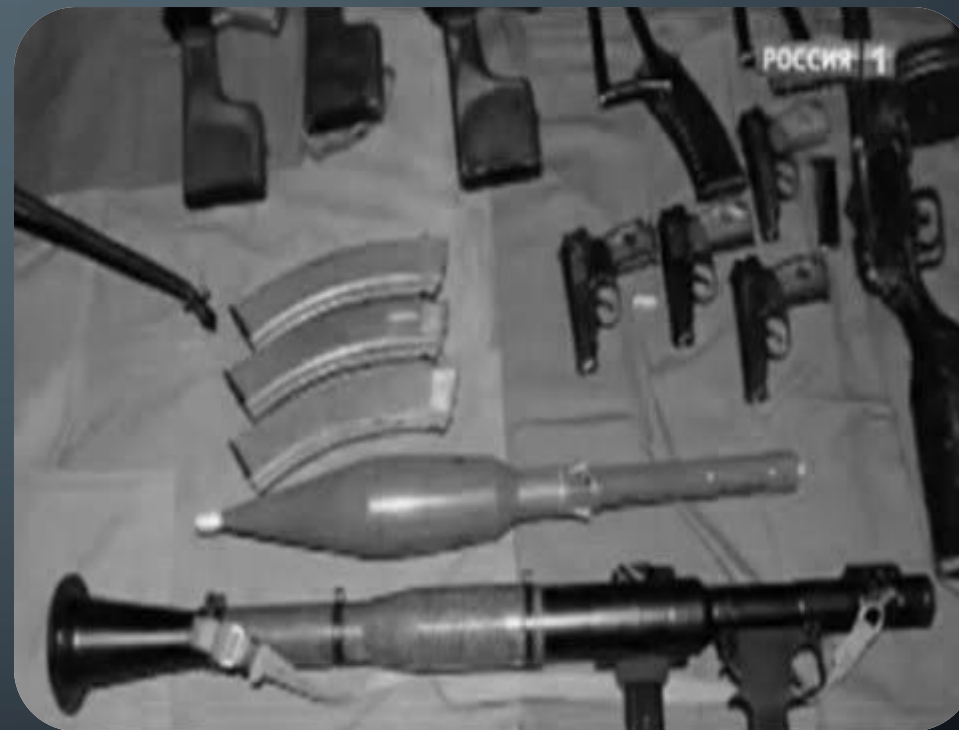
Арсенал огнестрельного оружия изъят у торговца оружием