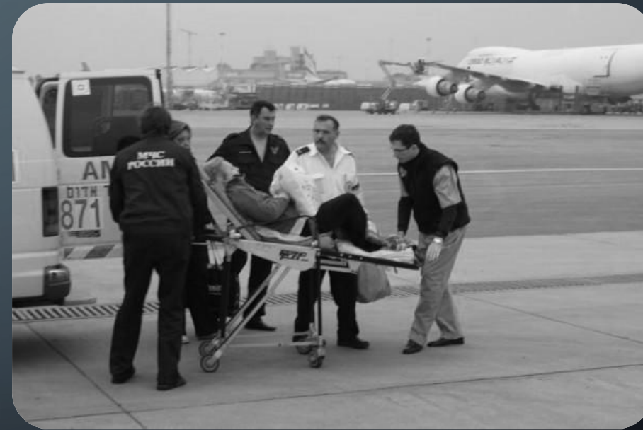
"Экстренная помощь пострадавшим при ЧС и ДТП"