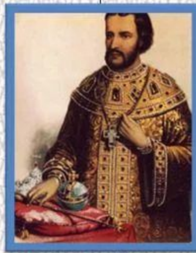
Иоанн V Алексеевич