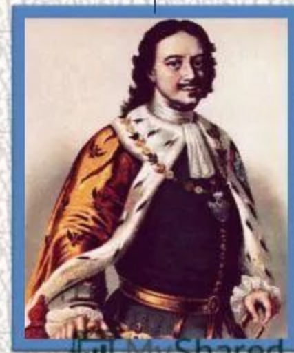
Петр I Алексеевич