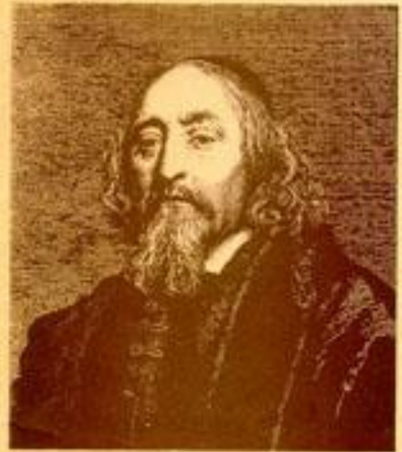
ЯН АМОС КОМЕНСКИЙ

Указатель русских переводов и критической литературы на русском языке 1772—1992