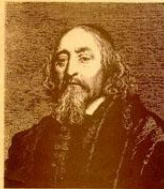
ЯН АМОС КОМЕНСКИЙ

Указатель русских переводов и критической литературы на русском языке 1772—1992