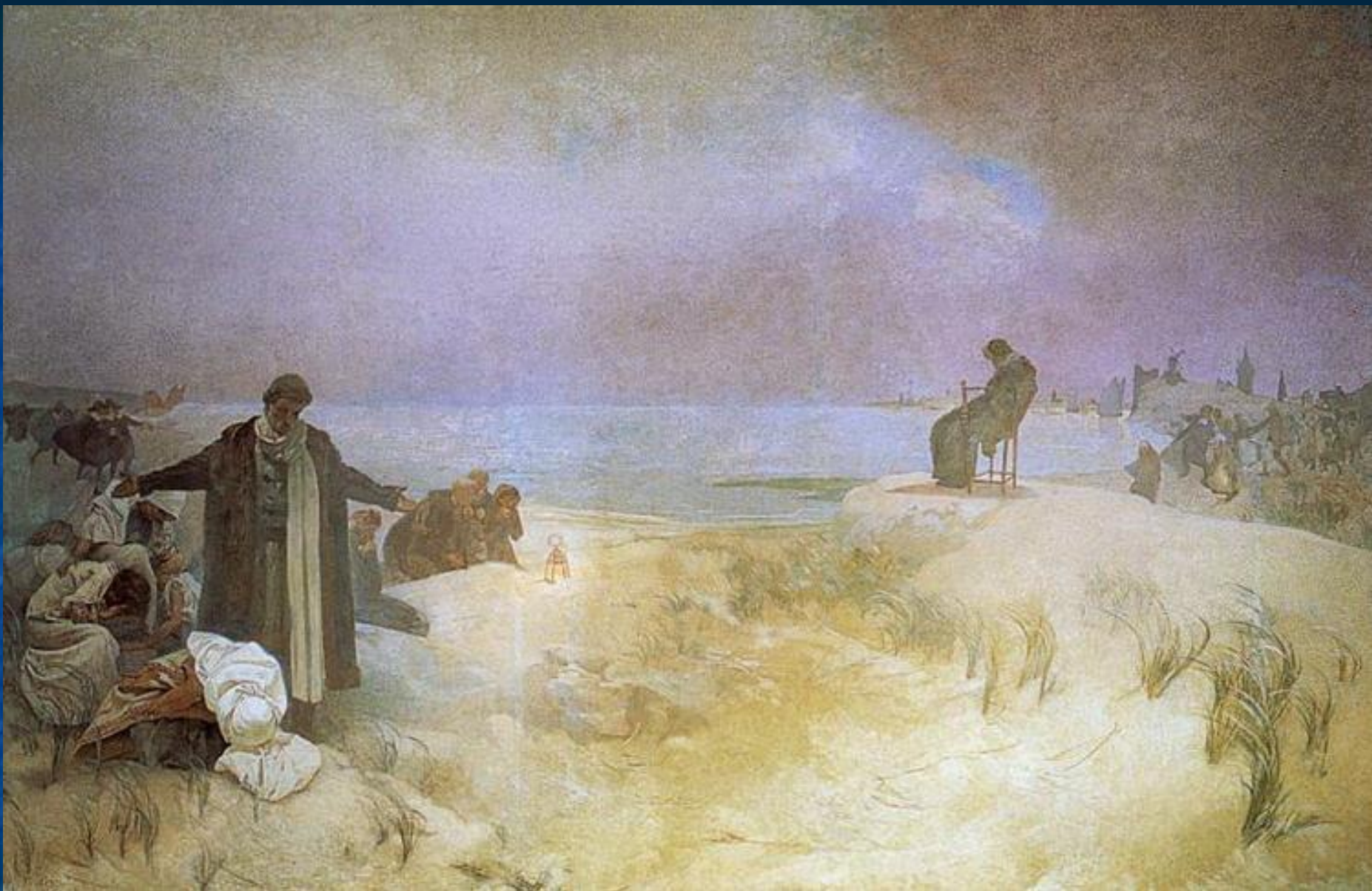
Ян Амос Коменский - последние дни в Наардене