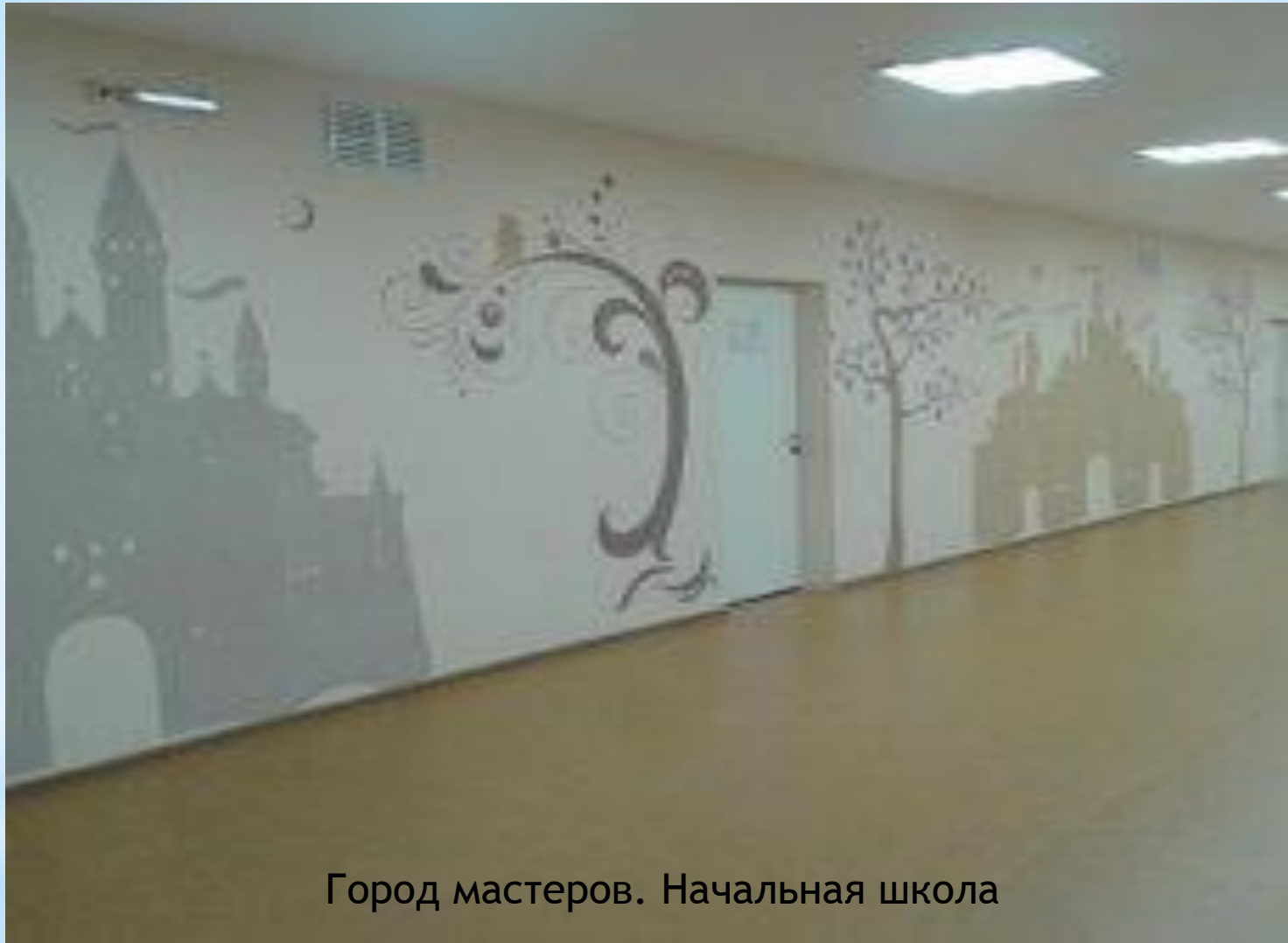
Город мастеров. Начальная школа