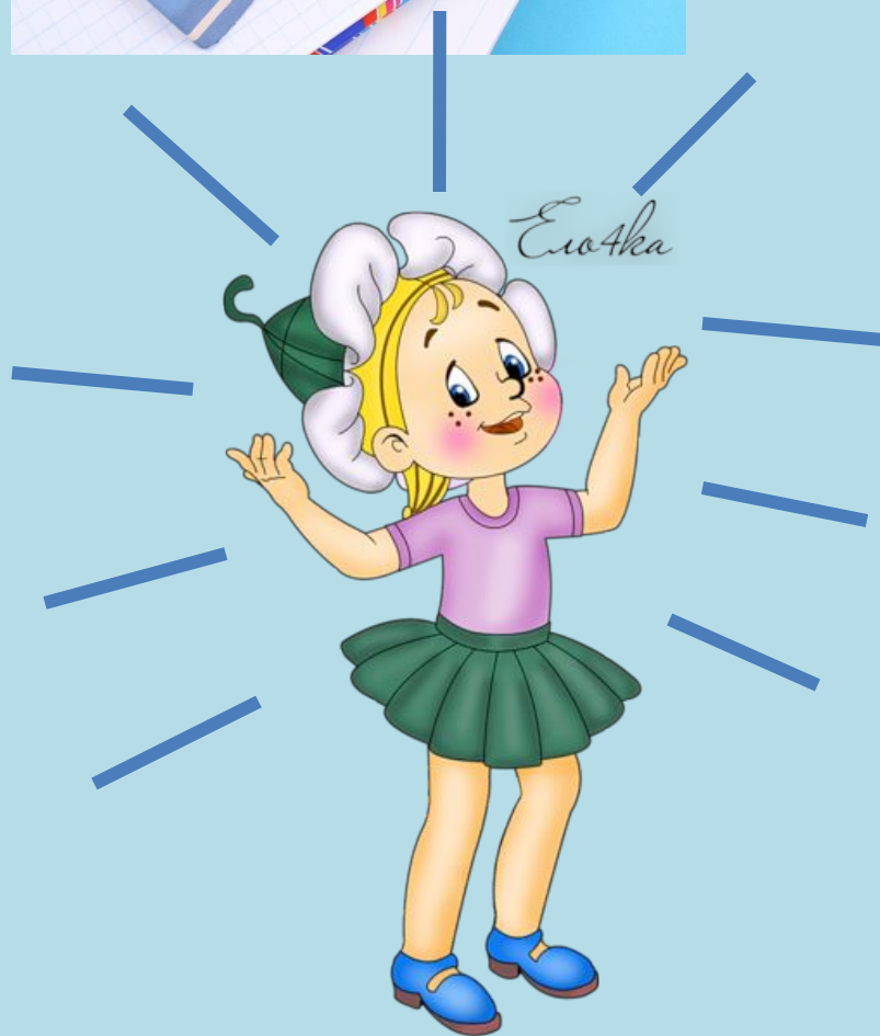
Рисунок будущего ребенка.