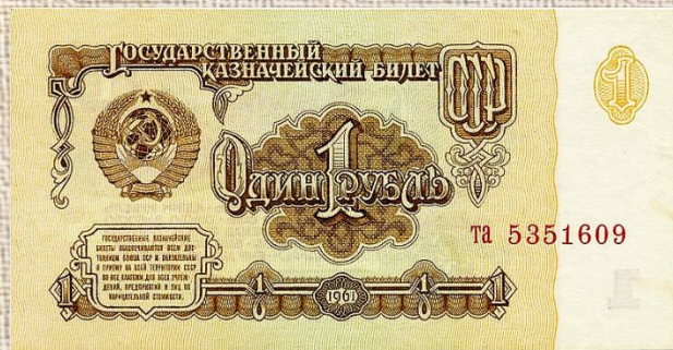
Рубль советского периода

Герб нужен государству, чтобы мы могли отличить моне ты своей страны от иностранных денежных знаков.