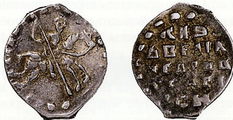
Копейка 1535–1538 гг.

Копье Святого Георгия Победоносца дало название монетке - копейка.