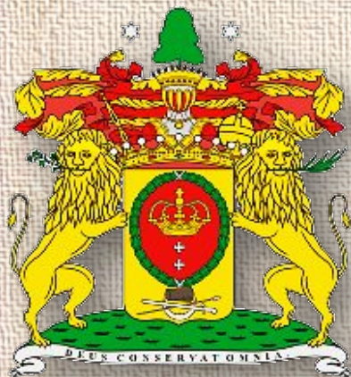
Герб рода графов Шереметьев