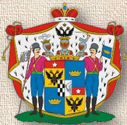
Герб рода графа Потёмкина-Таврического