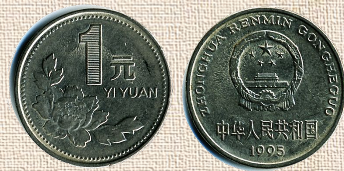
Китай, 1 юань