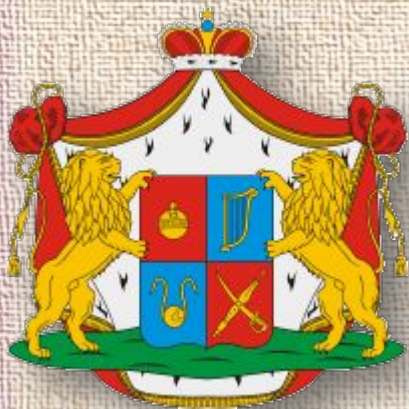
Герб рода князей Багратионов

Кроме гербов стран существуют гербы городов. Даже люди могут иметь свои гербы