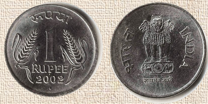
Индия, 1 рупия