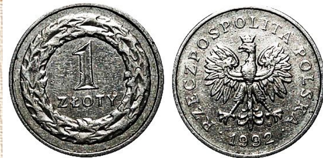
Польша, 1 злотый

Герб нужен государству, чтобы мы могли отличить моне ты своей страны от иностранных денежных знаков.