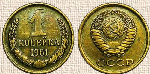
Копейка советского периода