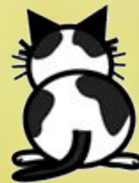
Рисунок о сказке «Котенок Саша»