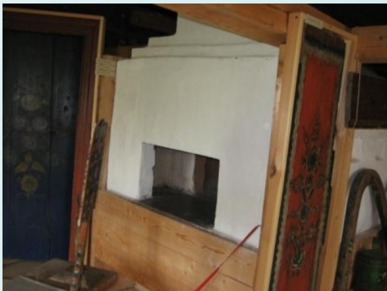
Усадьба с росписью (Чердынский район)