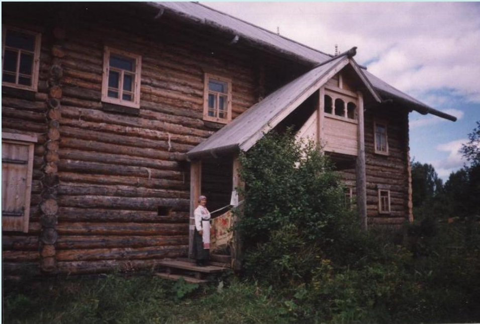
Изба Баяндиных-Боталовых (Коми-Пермяцкий округ)