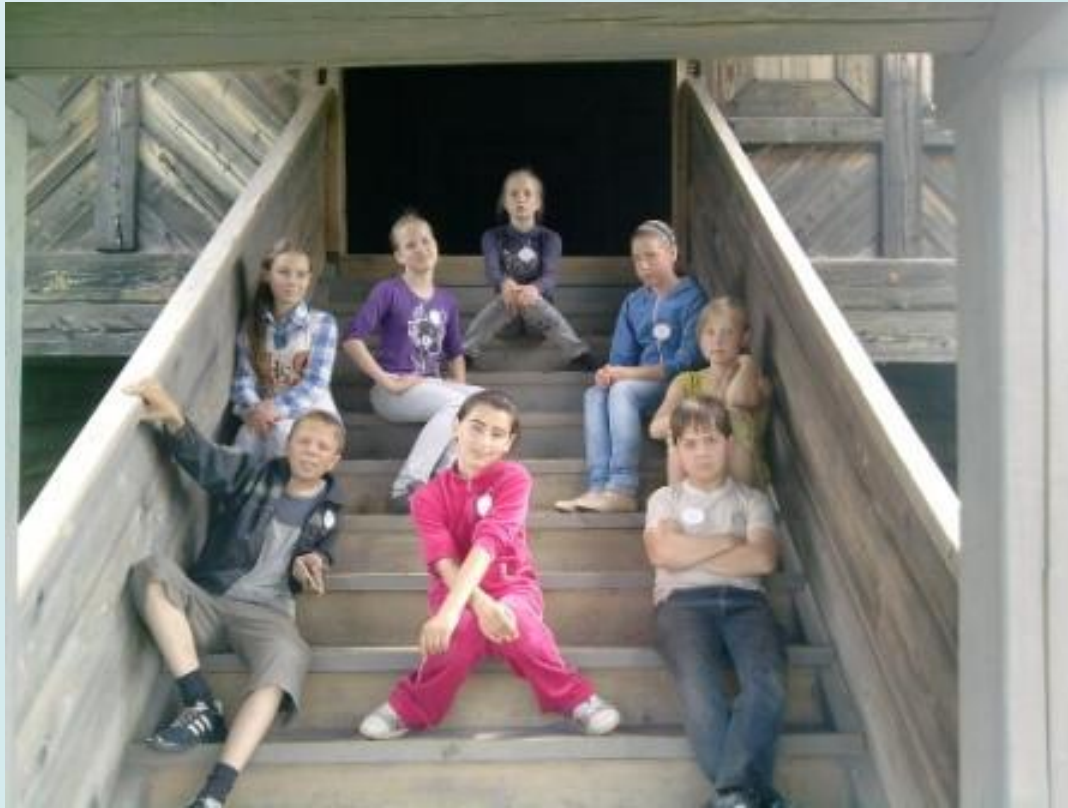
У входа в церковь Преображения