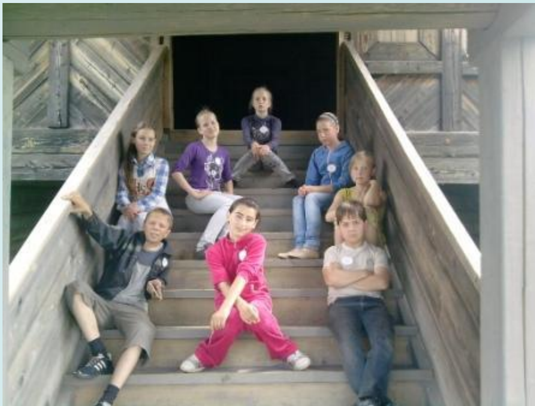
У входа в церковь Преображения