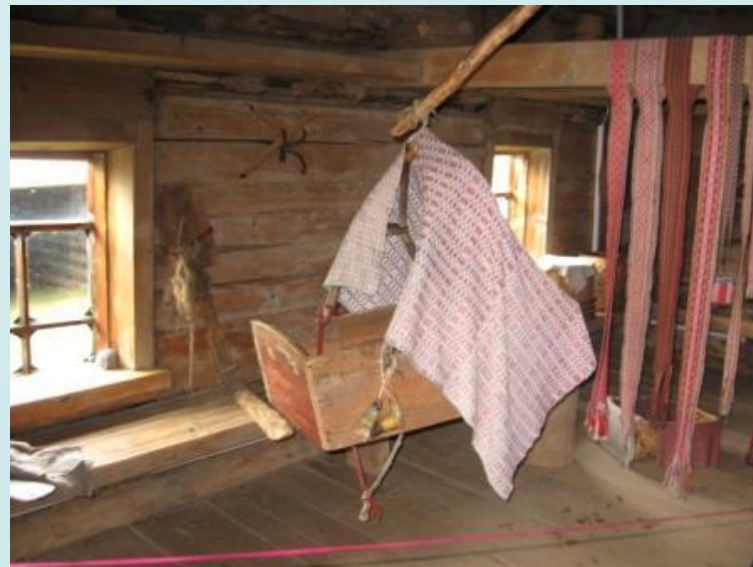
Интерьер избы Кудымовской усадьбы