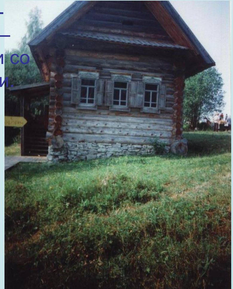
Усадьба Игошева (Уинский район)