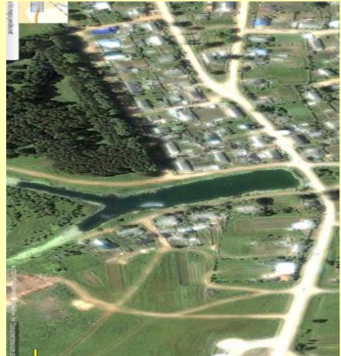
Рис. Карта п. Оричи со спутника. Братухинский пруд

Замерзает пруд 10 ноября (средняя дата). Средний срок вскрытия – 22 апреля.