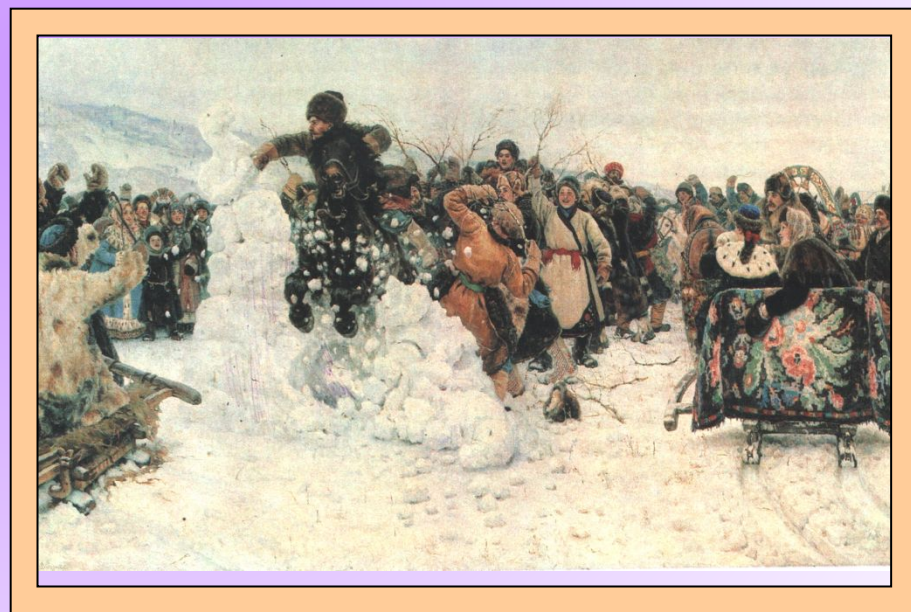
В. СУРИКОВ. «ВЗЯТИЕ СНЕЖНОГО ГОРОДКА»