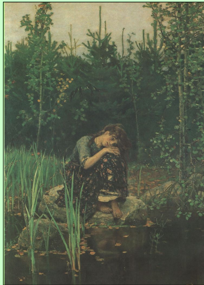
В. ВАСНЕЦОВ. «АЛЕНУШКА»