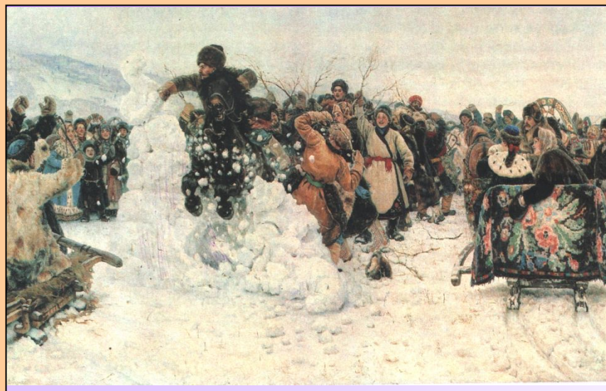
В. СУРИКОВ. «ВЗЯТИЕ СНЕЖНОГО ГОРОДКА»