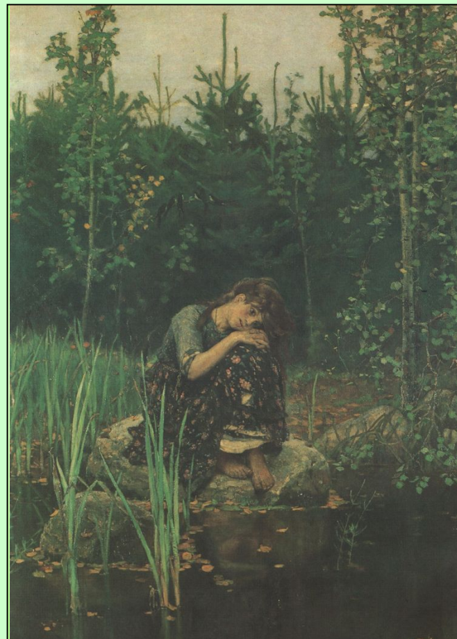
В. ВАСНЕЦОВ. «АЛЕНУШКА»