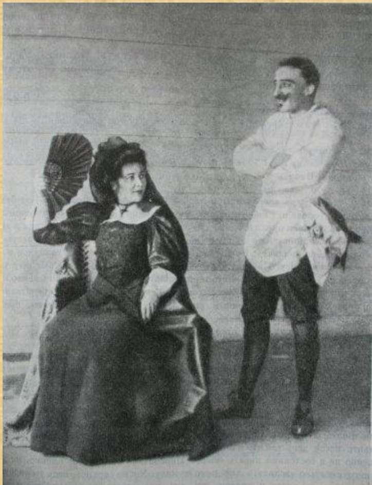
Блок в роли Дон-Жуана. 1899г