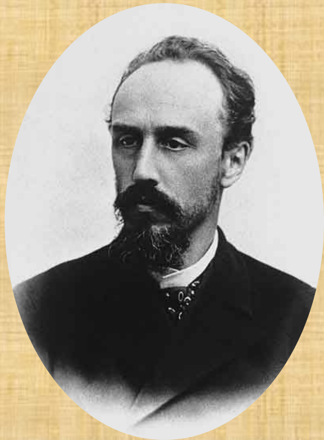
Александр Львович Блок