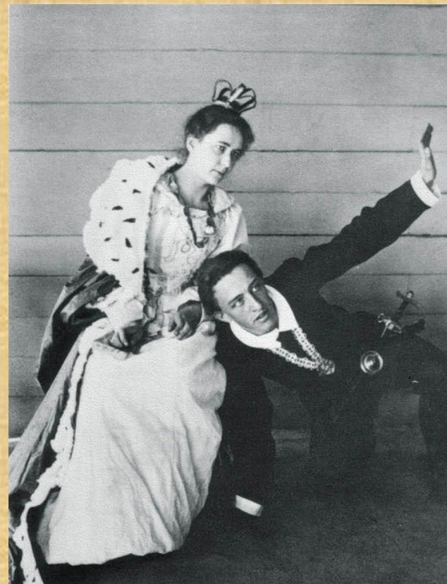
Александр Блок в роли Гамлета, 1898 г.