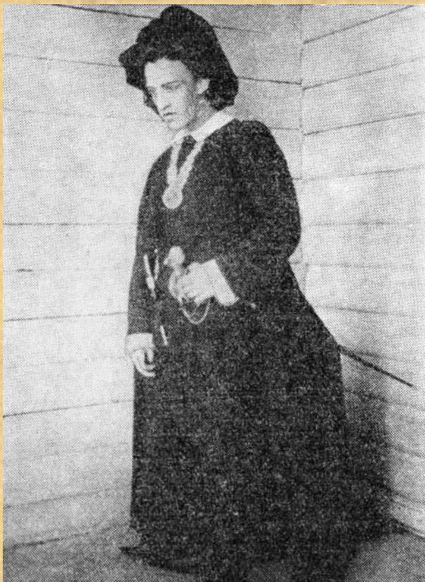
А. А. Блок в роли Гамлета в любительском спектакле Бобловского театра. Фотография. 1898 г.