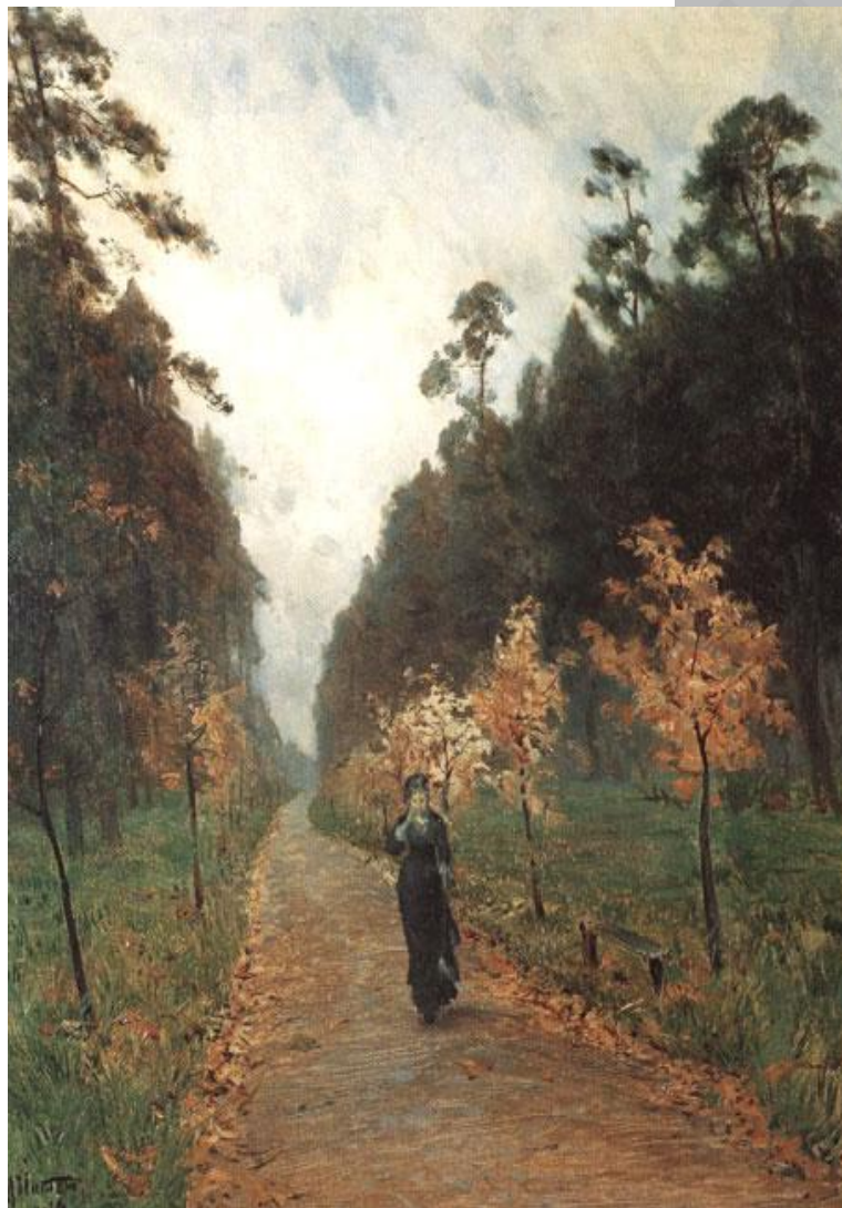
"Осенний день. Сокольники" .

Приехал и П.М. Третьяков, более 20 лет собиравший свою коллекцию. Неспешно переходил он от одной картины к другой, опытным взглядом оценивая их. Остановился перед картиной И.Левитана "Осенний день. Сокольники".