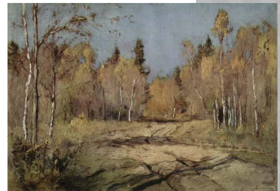
Осенний солнечный день. Этюд