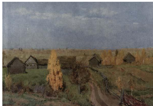
Золотая осень. Слободка.