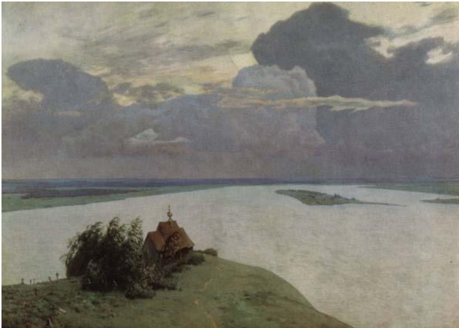
Над вечным покоем.