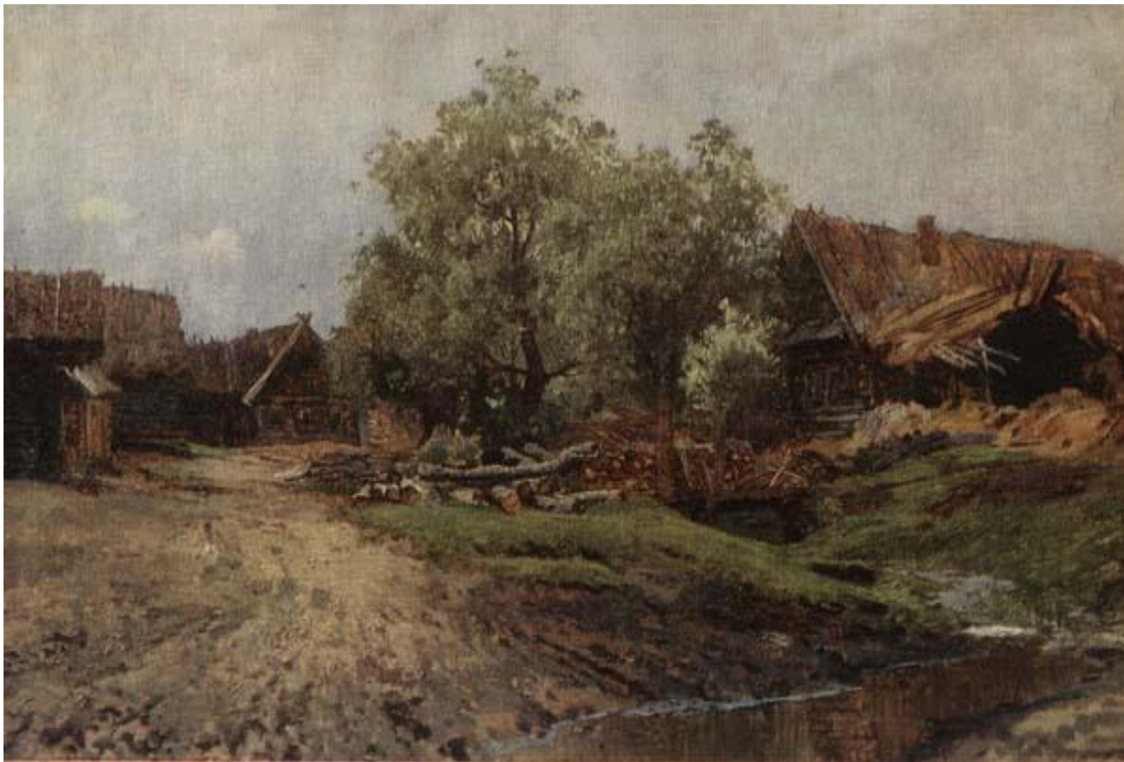
Саввинская слобода под Звенигородом.