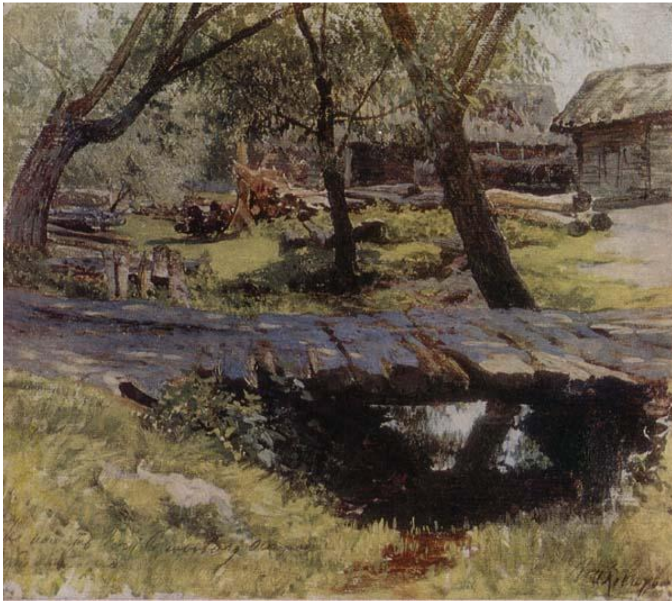
Мостик. Саввинская слобода. Этюд.