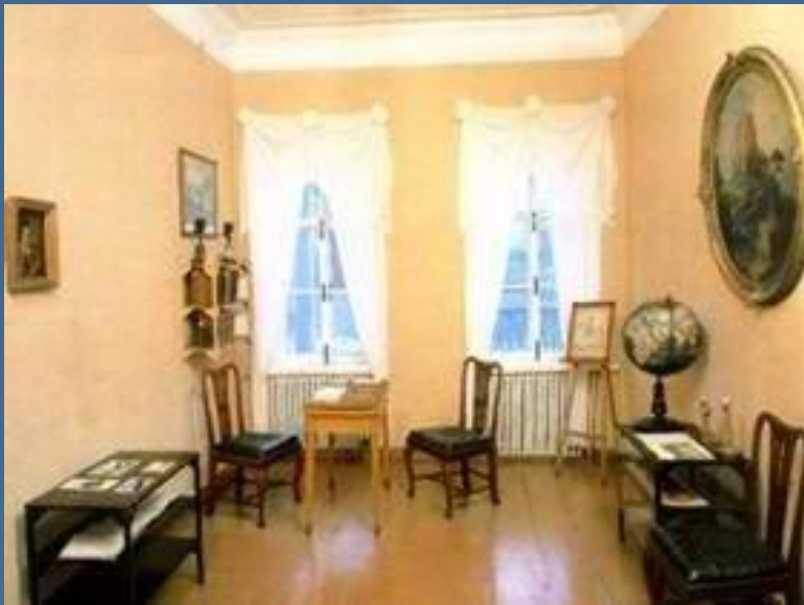
Классная комната, где учителя занимались с Лермонтовым.

С детства Лермонтов владел французским и немецким языками так же свободно, как и русским, изучал историю, географию, математику, словесность, выучился играть на скрипке и фортепьяно.