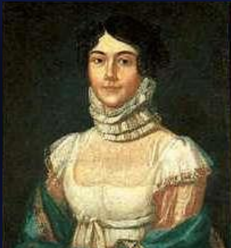
Мария Михайловна Лермонтова